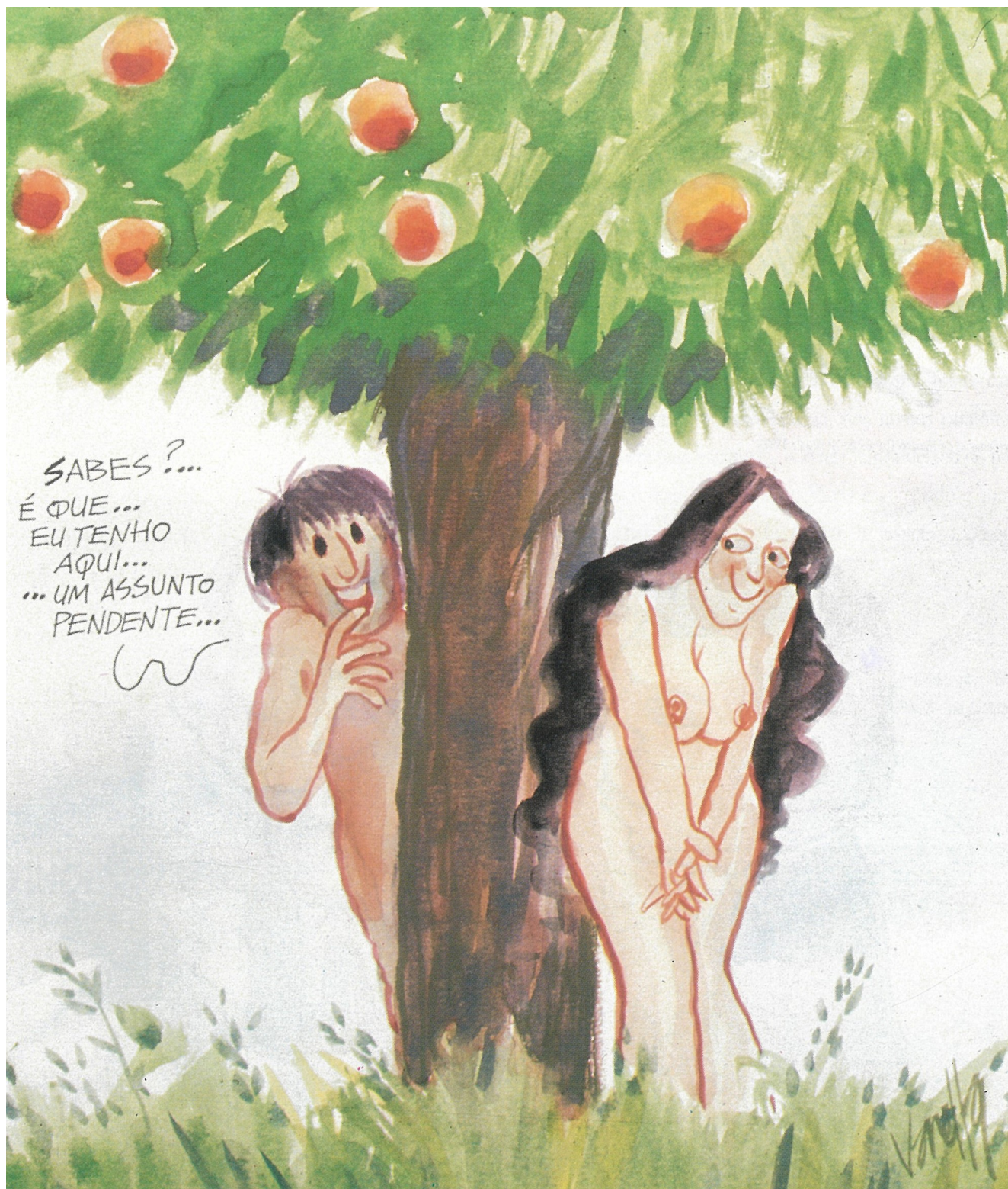
Adão e Eva. Cartune de Onofre Varela, publicado na revista Encontro (suplemento de fim-de-semana do jornal O Comércio do