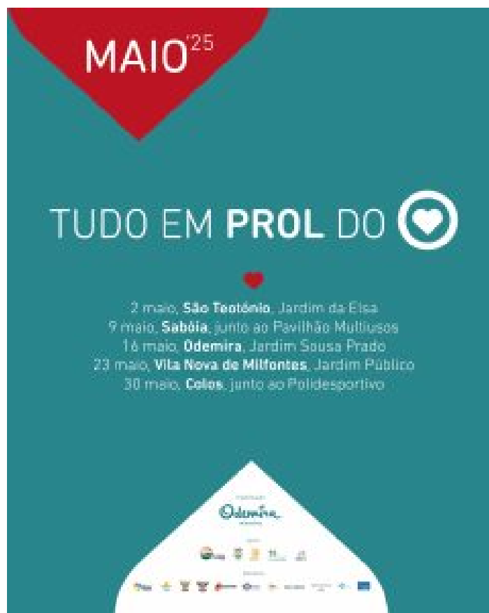
FLYER | CM ODEMIRA

A iniciativa contará com cinco momentos, a realizar em diferentes localidades do concelho: 2 de maio no Jardim da Elsa em São Teotónio, 9 de maio no Pavilhão Multiusos de Sabóia, 16 de maio no Jardim Sousa Prado em Odemira, 23 de maio no Jardim Público de Vila Nova de Milfontes e 30 de maio no Polidesportivo de Colos. As atividades incluem palestras sobre alimentação saudável, rastreios de saúde, ações de sensibilização e atividades desportivas, tudo pensado para promover o bem-estar físico e mental da comunidade.