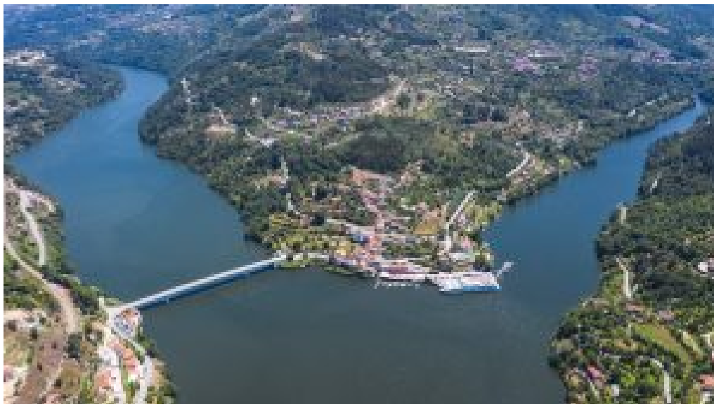
Porto Antigo.

O evento, organizado pela Associação de Desenvolvimento Rural Integrado das Serras de Montemuro, Arada e Gralheira ( ADRIMAG ), em parceria com os municípios da região , é limitado a 50 participantes e não tem caráter competitivo. O objetivo não é chegar primeiro, mas sim sentir cada metro do percurso, aproveitar cada vista, conhecer cada aldeia e saborear cada paragem. “Com alguns ajustes ao traçado inicial, estão agora reunidas todas as condições de segurança e qualidade para que esta primeira edição aconteça como planeado. A primavera oferece o cenário ideal para explorar as Montanhas Mágicas” , refere João Carlos Pinho, coordenador da ADRIMAG.