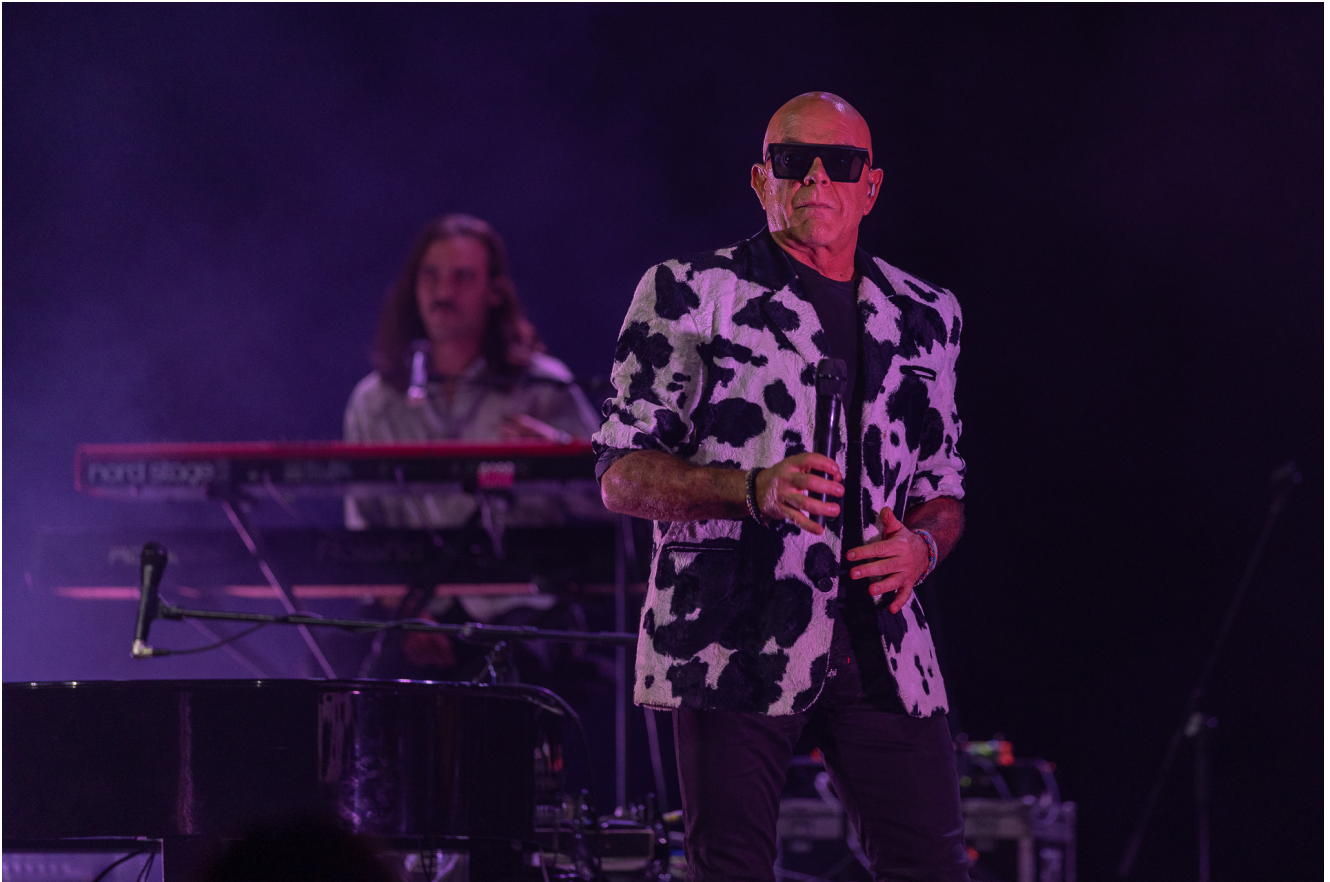
Pedro Abrunhosa.