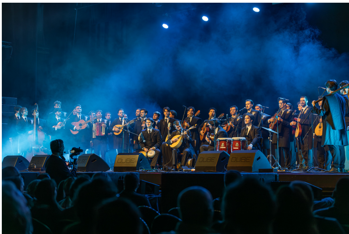
Orfeão Universitário do Porto.

Neste espetáculo feito de memórias, de referências e de grandes nomes evoca-se a identidade cultural da invicta. Uma referência que começou com as vozes masculinas do Orfeão Universitário do Porto que fizeram vibrar uma plateia que elevou a voz desde o início dos primeiros acordes de "Porto sentido" de Rui Veloso , reforçando desde a primeira estrofe "Quem vem e atravessa o rio..." – o símbolo maior do amor e da identidade do Porto.