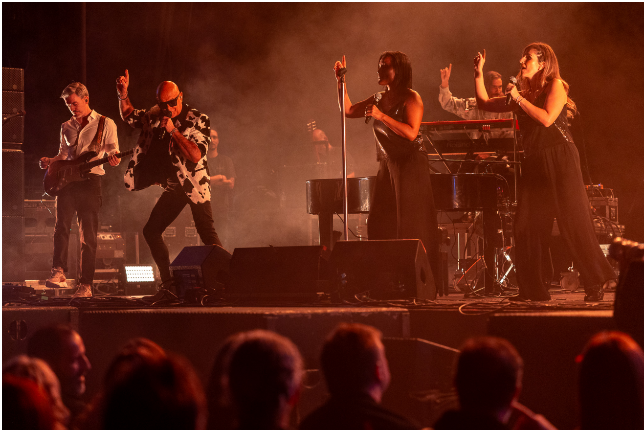
Pedro Abrunhosa.