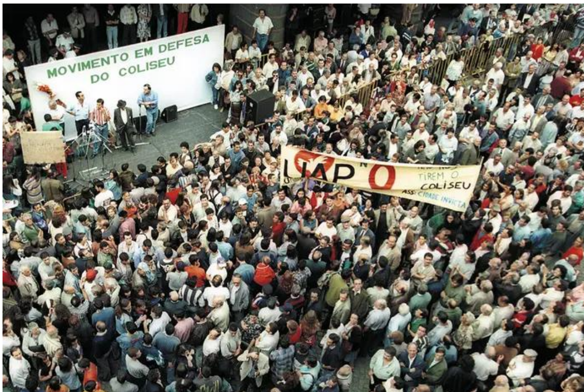
Manifestação em defesa do Coliseu do Porto

duradouro da defesa do património e da identidade cultural da cidade.