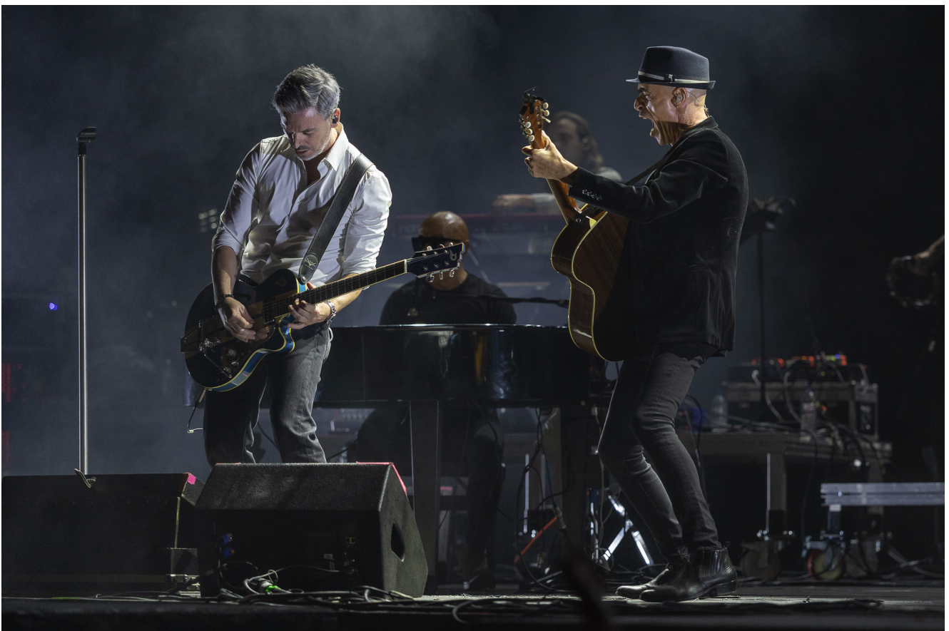
Pedro Abrunhosa.