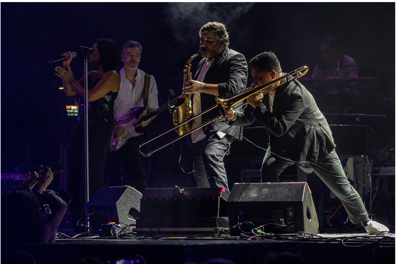
Pedro Abrunhosa.