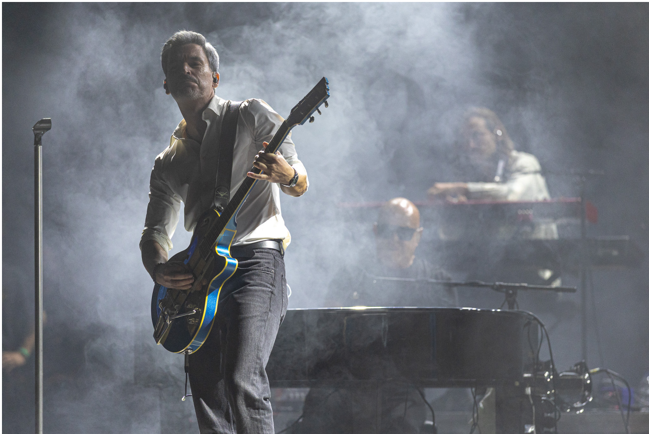
Pedro Abrunhosa: .