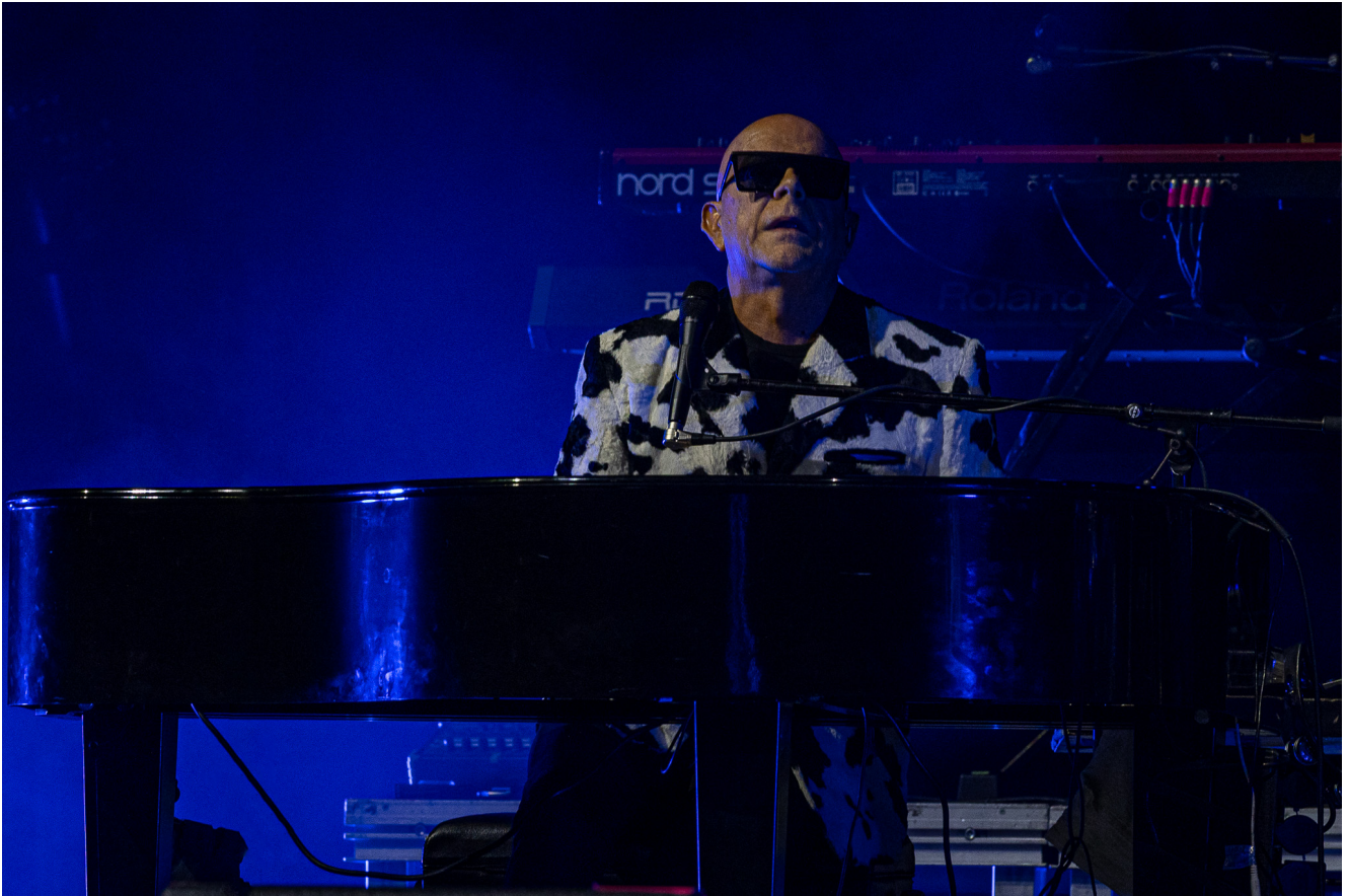
Pedro Abrunhosa.