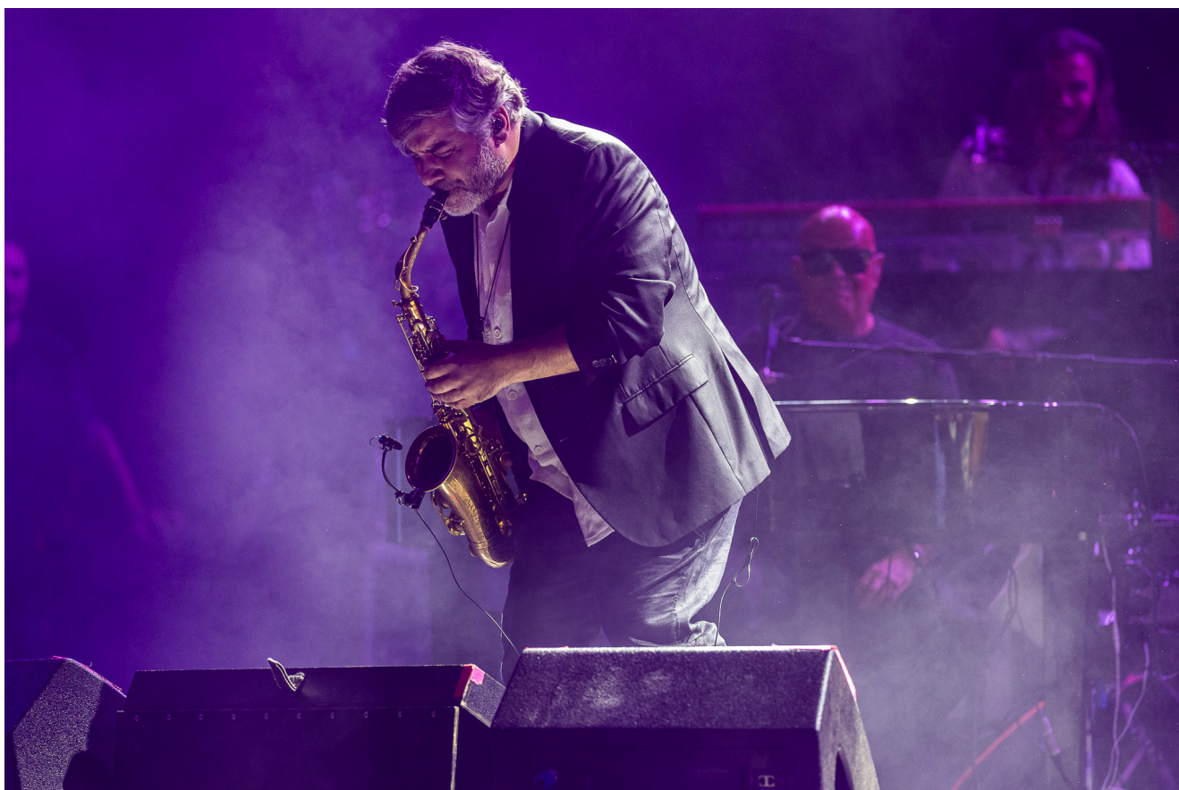
Pedro Abrunhosa.