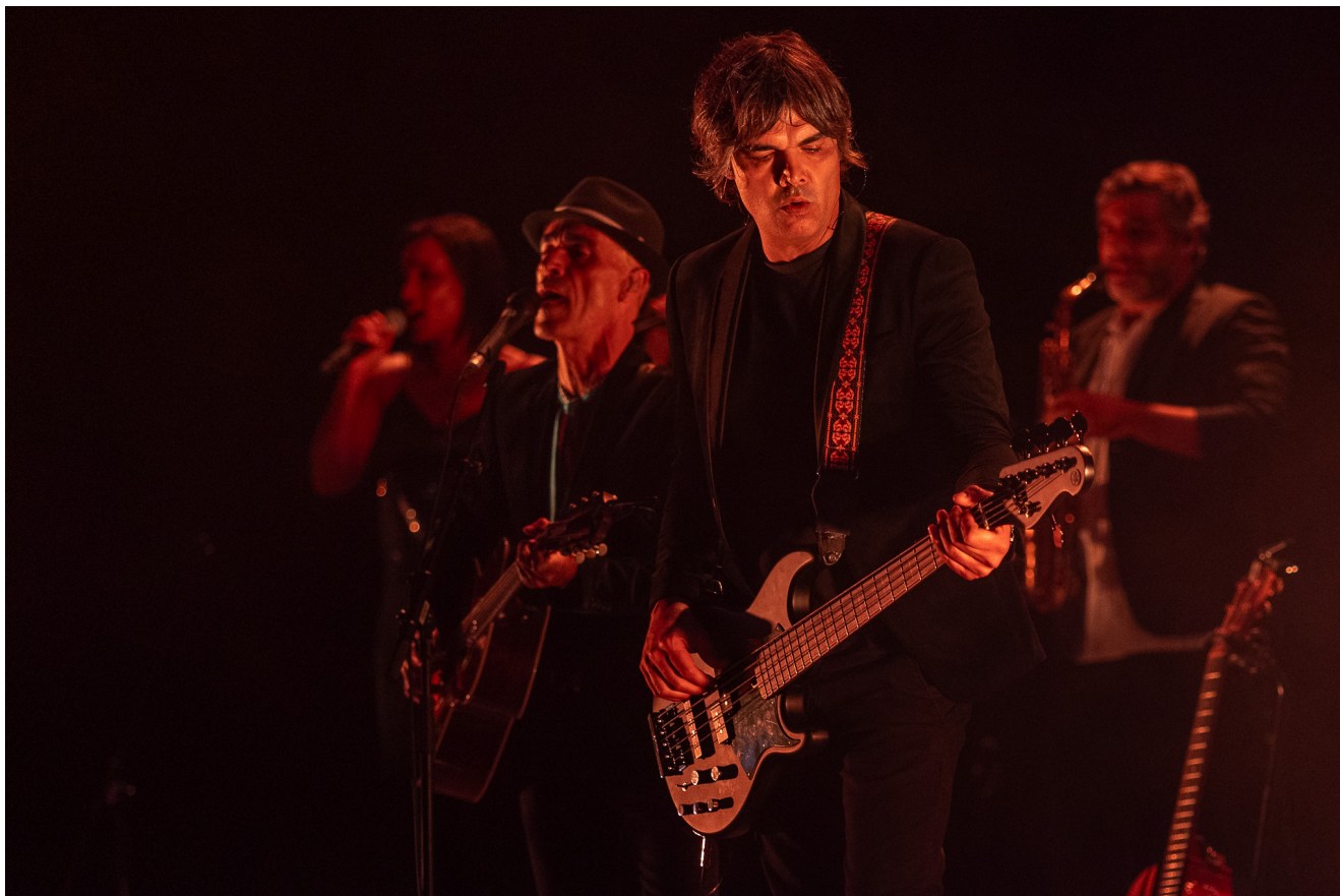
Pedro Abrunhosa.