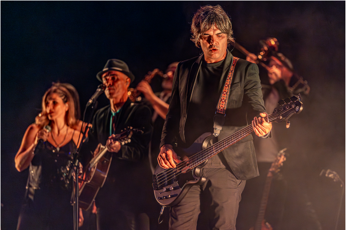
Pedro Abrunhosa.