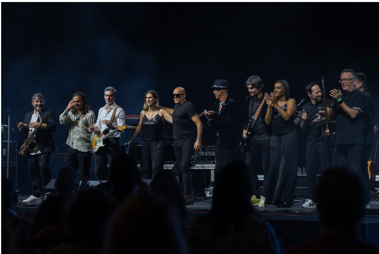
Pedro Abrunhosa.