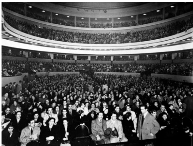
Concerto inaugural a 19 de Dezembro de 1941

grandes nomes nacionais e internacionais como Beatriz Costa , Hermínia Silva , o mimo Marcel Marceau e o bailarino Rudolf Nureyev . Montagens de ópera como La Bohème e Rigoletto , apresentadas pela Orquestra Sinfónica Nacional e pelo Corpo Coral do Teatro Nacional de São Carlos , partilhavam a agenda com projeções de êxitos como West Side Story e Música no Coração . Também o Festival da Canção Portuguesa encontrou aqui uma das suas casas mais emblemáticas.