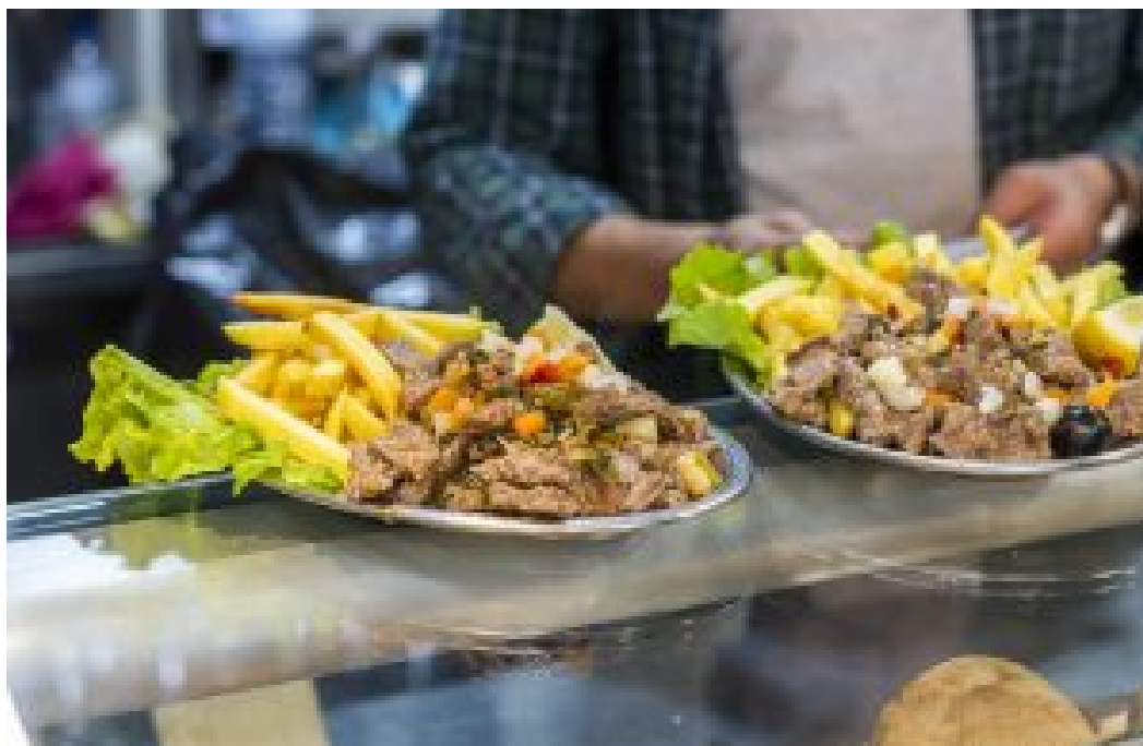
QUEM NÃO TASCA NÃO PETISCA (1ª edição) – FOTO | TASCANDO | DIREITOS RESERVADOS

Do universo de 81 tascas participantes nesta segunda edição, que duplica o número da edição inaugural , apenas cerca de duas dezenas são repetentes que concorrem com novos pratos ou petiscos, ou com uma nova versão da do ano passado.