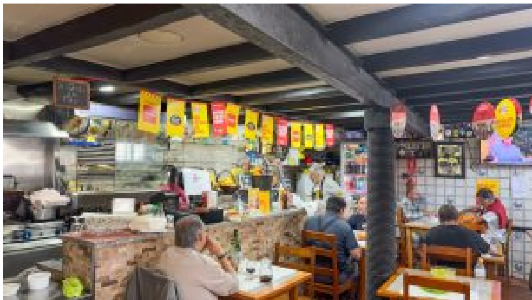
QUEM NÃO TASCA NÃO PETISCA (1ª edição)

O concurso tem dois perfis de voto: o dos jurados e o do público , que apenas pode votar fisicamente no espaço, colocando numa urna o boletim de voto preenchido. Na ponderação final, júri e público valem 50% cada. A recolha e apuramento dos votos serão controlados por uma auditoria externa.