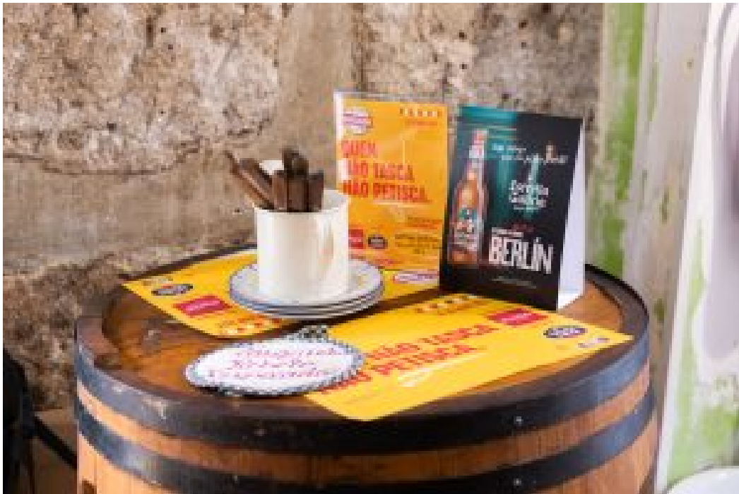
QUEM NÃO TASCA NÃO PETISCA (1ª edição)

Em 2024, o conceito atravessa o Atlântico e chega a Portugal com o objetivo de criar um movimento nacional que eleva o valor da cozinha de raiz popular, eternizando a presença da “comidinha boa” no nosso dia-a-dia , numa lógica de valorização da gastronomia portuguesa e da origem das tascas.