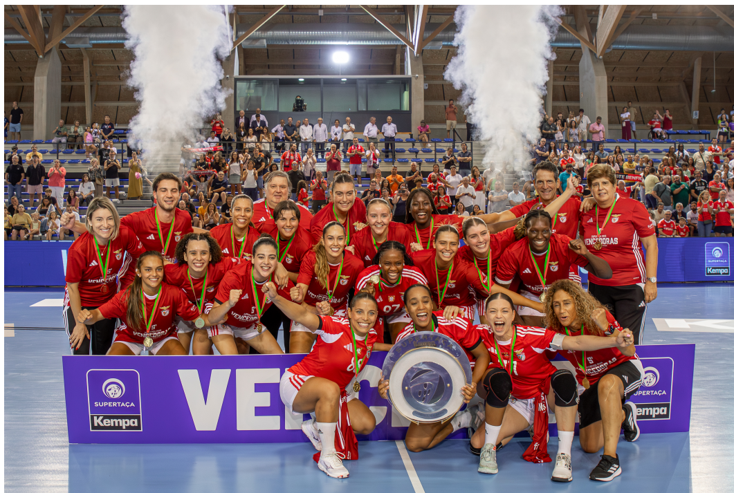
Madeira SAD

bem o contra-ataque e castigando os erros ofensivos da equipa madeirense, ampliaram a vantagem vencendo o Madeira SAD por 26-18 , conquistando o troféu feminino, a quinta Supertaça da história do Andebol feminino do SL Benfica, depois de, na última edição, que teve lugar no Funchal, as insulares terem erguido o troféu.