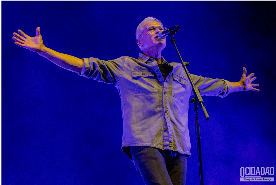
Ecos da Cave – Alfredo

Um dos momentos marcantes da banda foi sua participação no 5º Concurso do Rock Rendez-Vous em 1988, onde alcançaram as semifinais. O single “Desejo” , gravado e produzido por Zé Nabo , foi incluído na compilação Registos, que reúne as oito melhores bandas do concurso.