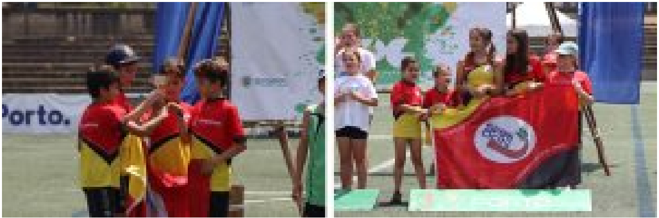
Coletivos masculino e feminino.

“Apesar dos resultados desportivos conquistados, ficam as experiências, os desafios superados e o gosto pelo desporto. O Clube Spiridon de Gaia é um clube formador, e a formação é isto mesmo: aprender, evoluir e construir um futuro risonho”, referiu o clube em nota de imprensa.