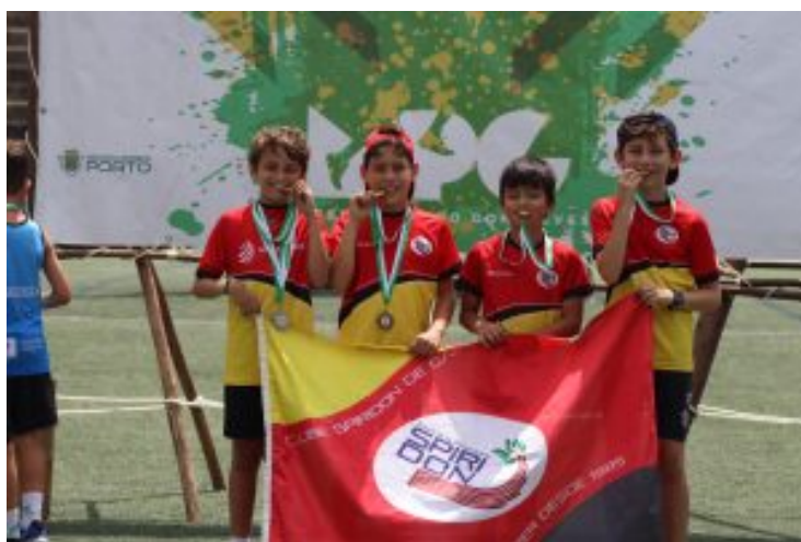
Os Campeões de estafeta 4x60m.

A equipa masculina de estafeta 4x60 metros foi campeã regional .