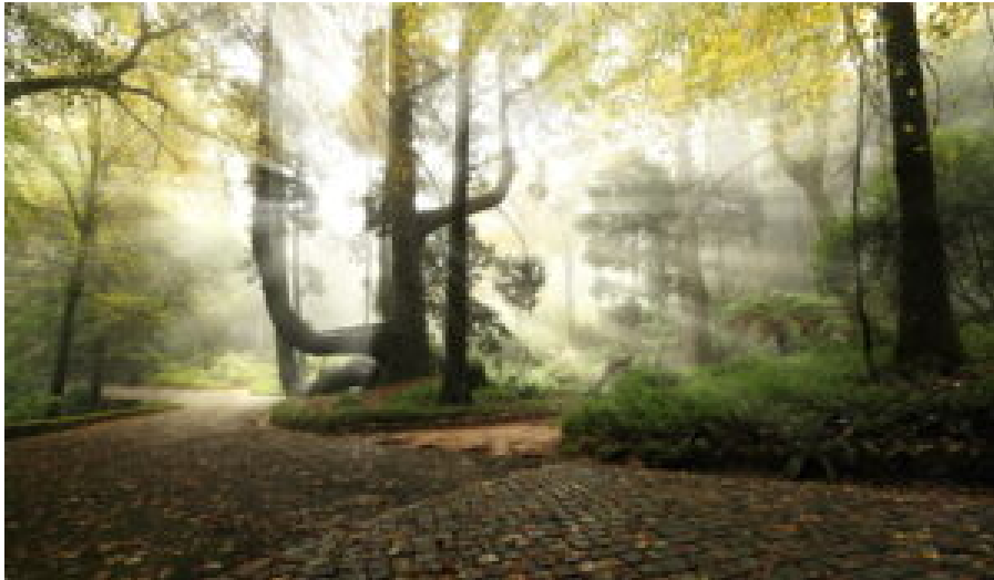
Tuia gigante.

O mês encerra com dois dias dedicados ao BTT na Tapada D. Fernando II , a 27 e 28 de setembro . Os participantes serão convidados a pedalar em percursos que exploram a relação entre paisagem, património e biodiversidade, respondendo a desafios ligados à gestão florestal e à história do território.