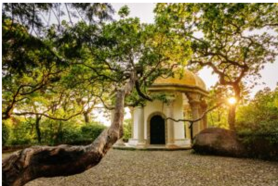
Templo das Colunas.

As inscrições decorrem na plataforma Sintra PH30 e têm um custo simbólico de 1 euro por participante. A participação em cinco das 30 iniciativas programadas garante ainda acesso a prémios adicionais.