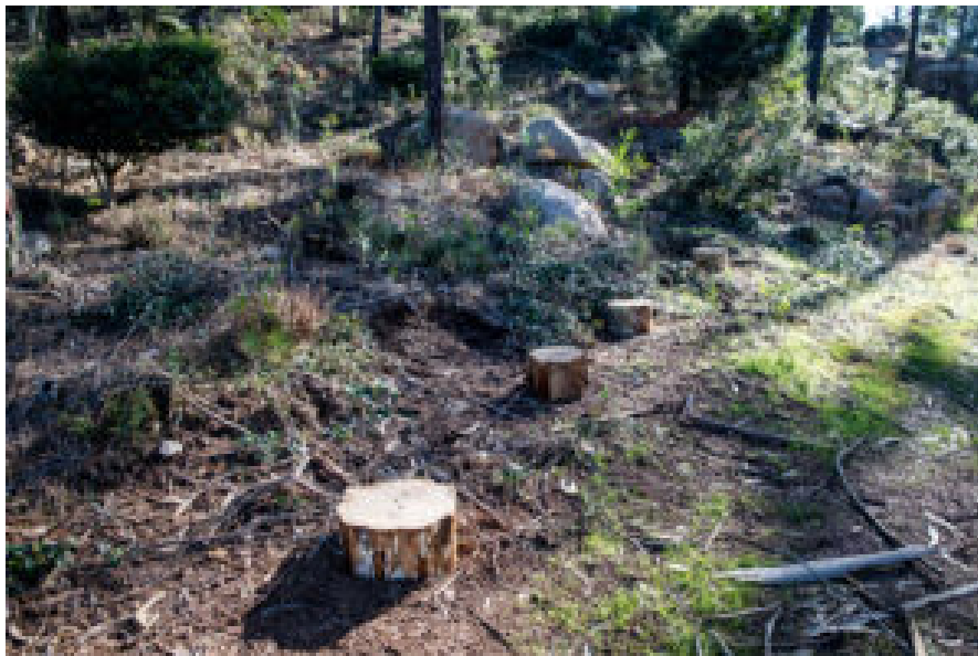
Tapada D. Fernando II.

O mês encerra com dois dias dedicados ao BTT na Tapada D. Fernando II , a 27 e 28 de setembro . Os participantes serão convidados a pedalar em percursos que exploram a relação entre paisagem, património e biodiversidade, respondendo a desafios ligados à gestão florestal e à história do território.