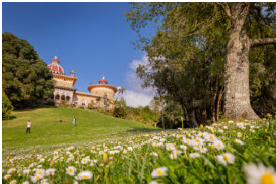
Parque e Palácio de Monserrate.