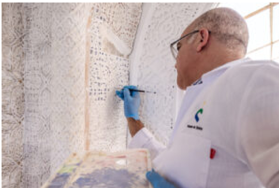
Restauro dos estuques em curso.

No dia 20 de setembro , às 10:30 , o Palácio Nacional da Pena recebe uma visita temática Open Heritage , dedicada à arte dos estuques no Gabinete Árabe . A sessão permitirá conhecer de perto as técnicas de conservação e restauro atualmente em curso.