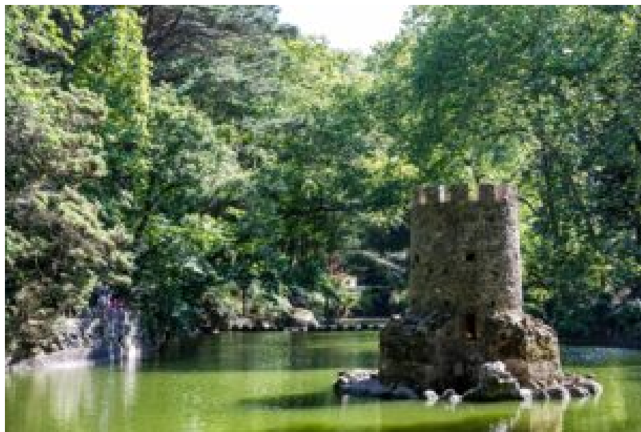
Vale dos Lagos.

objetivo é aproximar os jovens do património cultural, através de experiências que combinam aventura, conhecimento e contacto com a natureza.