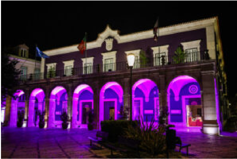
Evocação do Terramoto de 1755.

Nesta segunda edição, que assinalou a passagem dos 270 anos do sismo que destruiu grande parte de Lisboa e de diversas localidades da costa portuguesa, incluindo Setúbal, edifícios públicos e monumentos em diversos locais do país iluminaram-se de roxo, a cor que simboliza a iniciativa.