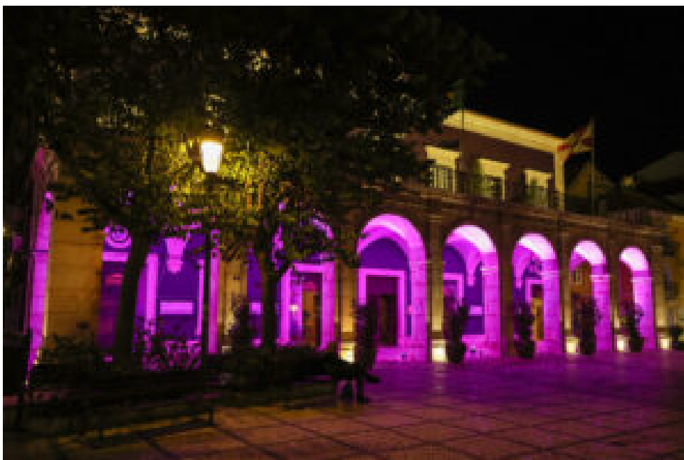
Evocação do Terramoto de 1755.

Nesta segunda edição, que assinalou a passagem dos 270 anos do sismo que destruiu grande parte de Lisboa e de diversas localidades da costa portuguesa, incluindo Setúbal, edifícios públicos e monumentos em diversos locais do país iluminaram-se de roxo, a cor que simboliza a iniciativa.