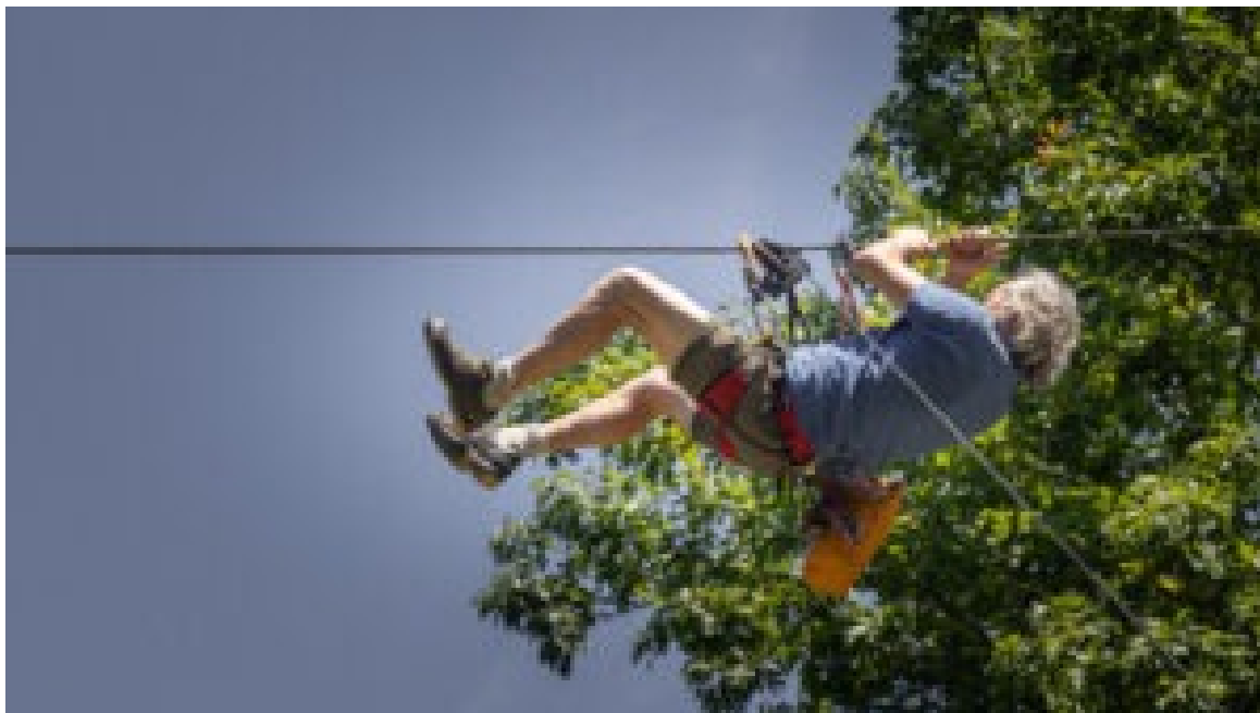
Serralves em Festa.