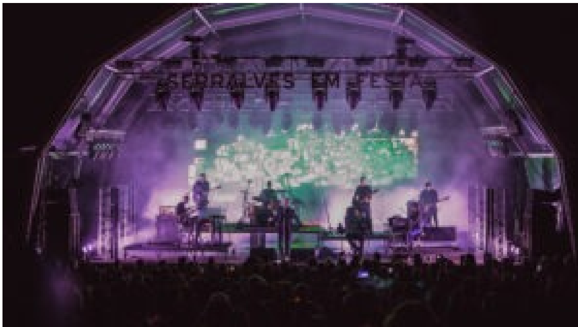
Serralves em Festa.