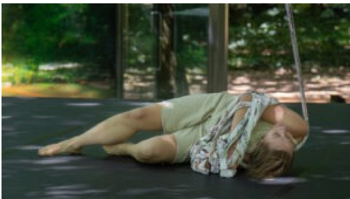
Serralves em Festa.

O evento, que já é uma referência incontornável no roteiro cultural europeu, estendeu-se por todo o complexo da Fundação, ocupando o Parque, o Museu e a Casa do Cinema Manoel de Oliveira.