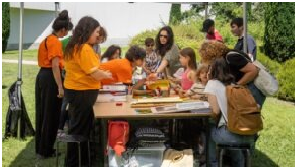
Serralves em Festa.