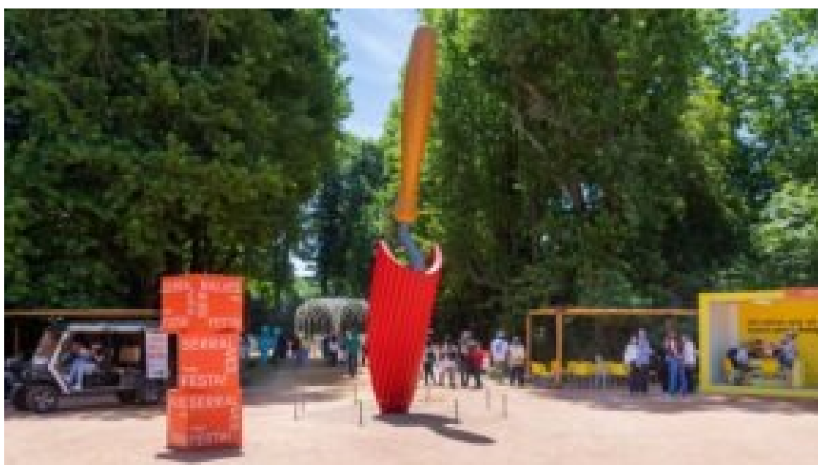
Serralves em Festa.