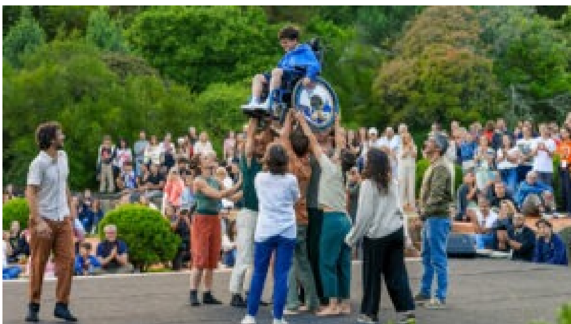
Serralves em Festa.