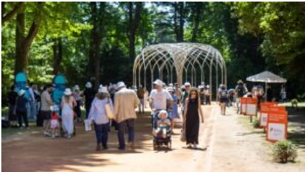
Serralves em Festa.