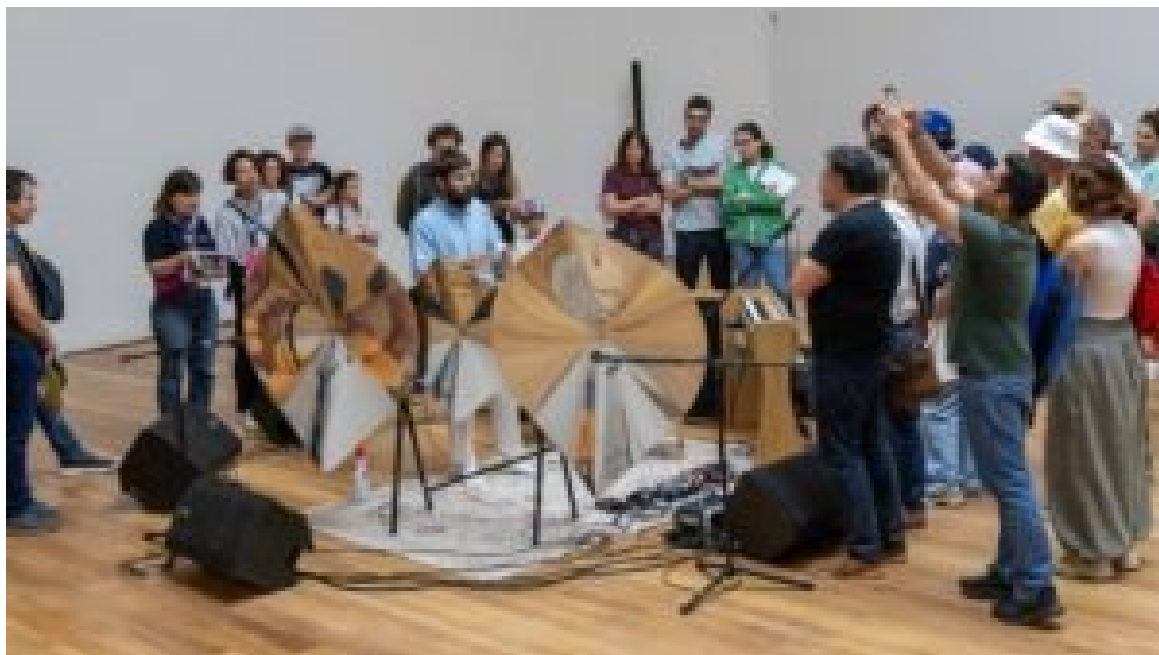
Serralves em Festa.

contemporâneo, sessões de cinema, teatro de rua, oficinas e diversas atividades pedagógicas para famílias.