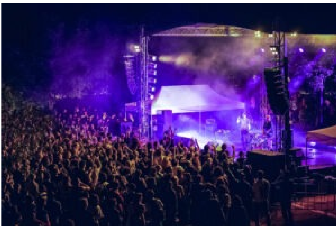
Serralves em Festa.

A fusão entre a natureza do Parque e as vanguardas artísticas voltou a ser a imagem de marca de um festival que, duas décadas depois, continua a democratizar o acesso à cultura e a pulsar no coração da cidade do Porto.