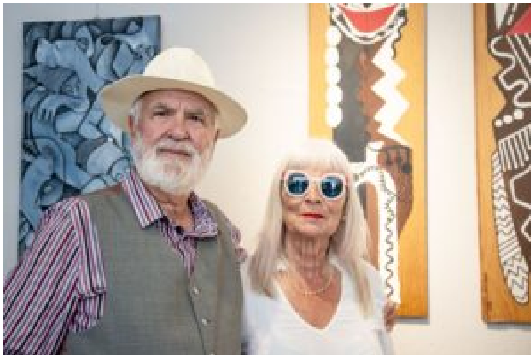
Art Gallery D. Pedro, no Porto, acolhe exposição “Sem Amarras”.

A poucos dias das comemorações da Revolução de 25 de Abril de 1974, a exposição estabelece uma ligação simbólica com os valores de liberdade e expressão, posicionando-se como um espaço de encontro entre criação artística e memória coletiva.