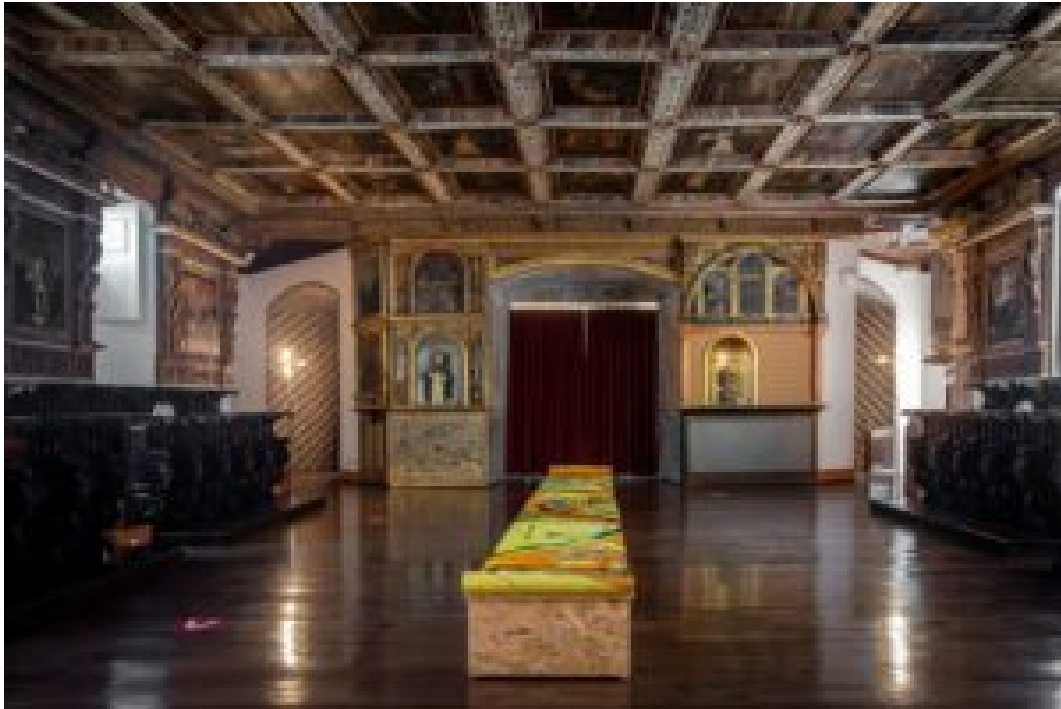
O CORO ALTO

As freiras viviam uma vida de absoluta simplicidade material, mas de riqueza espiritual.