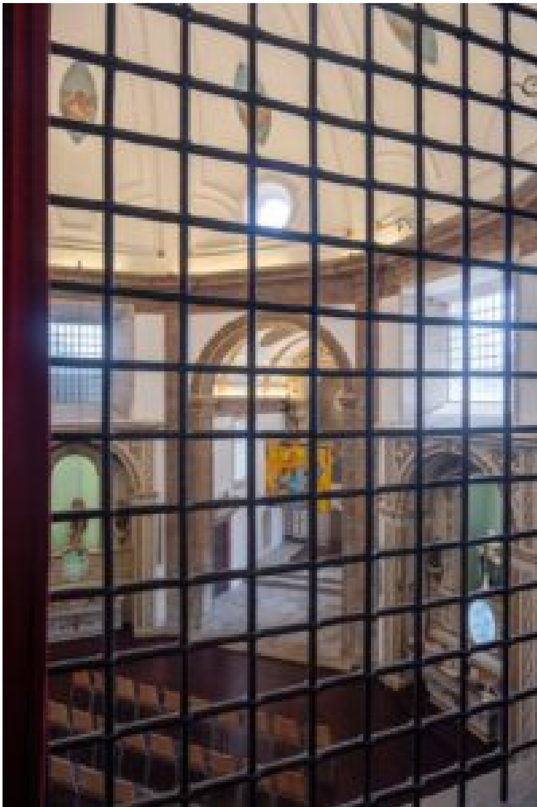
VARANDAS COM GRADES ONDE AS FREIRAS ASSISTIAM ÀS MISSAS