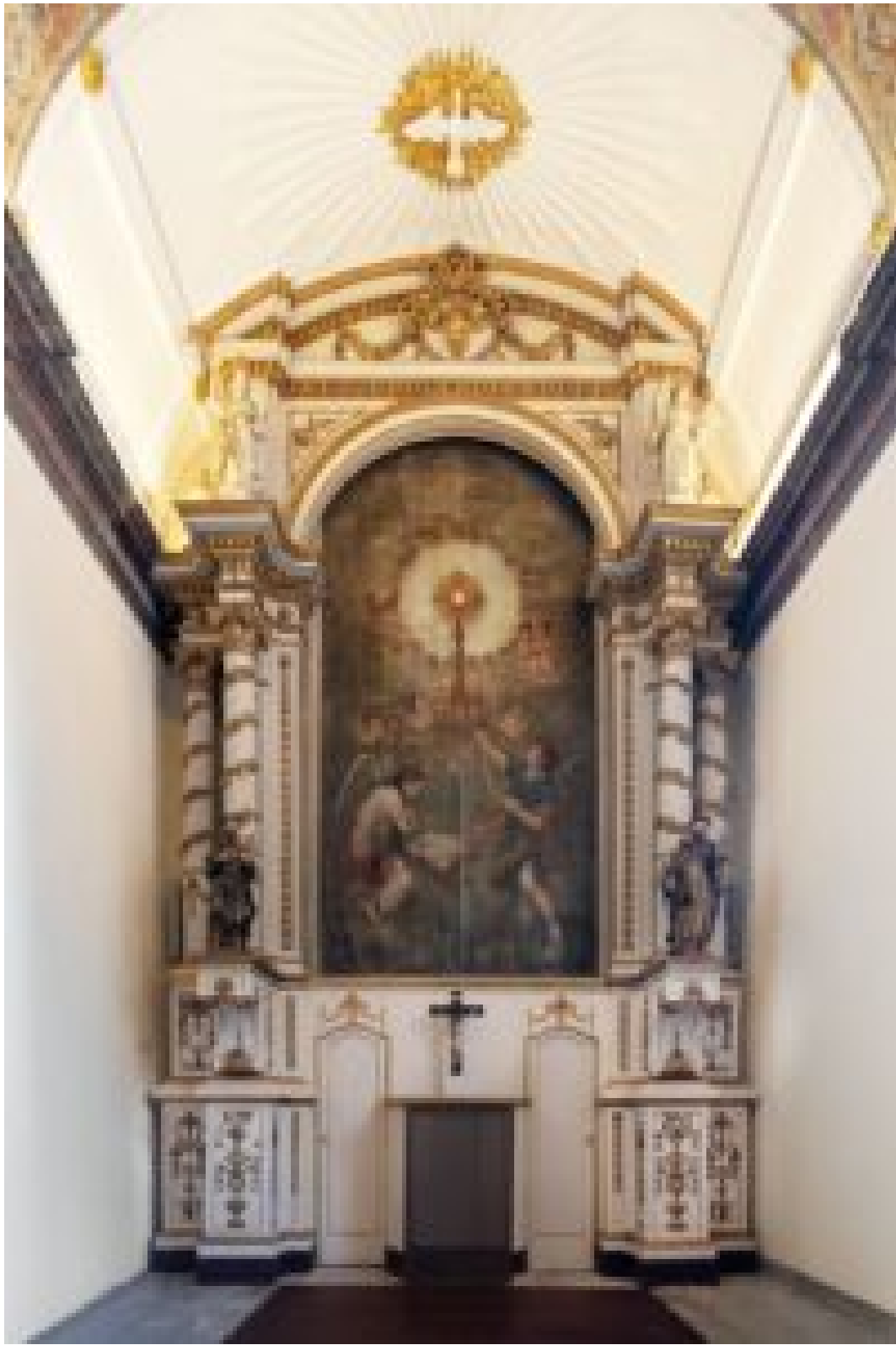
O ALTAR