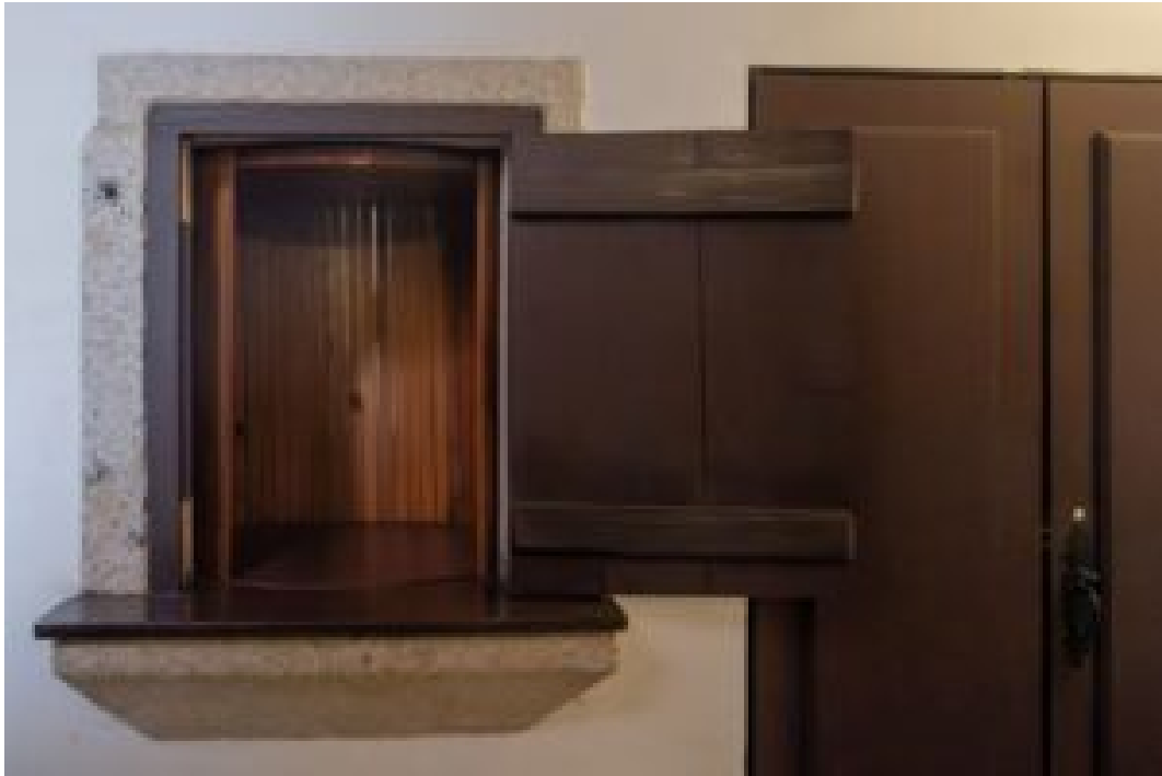
A RODA DOS EXPOSTOS, UM MECANISMO QUE PERMITIA O ABANDONO ANÓNIMO DE RECÉM-NASCIDOS

Embora a vida religiosa tenha retomado, o século XX trouxe novos desafios. O envelhecimento das comunidades religiosas e a diminuição de vocações tornou-se um fenómeno generalizado. Em 1990, as últimas freiras fecharam definitivamente a porta da clausura no Corpus Christi.