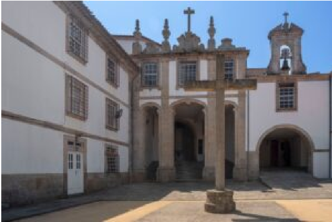
A ENTRADA NO CONVENTO CORPUS CHRISTI