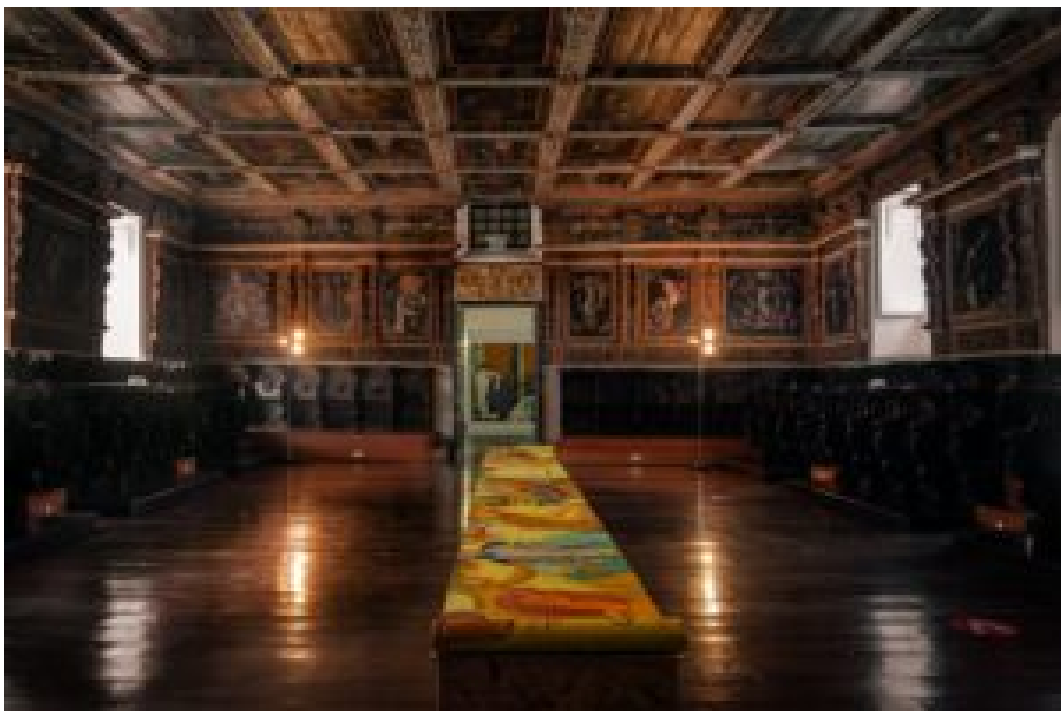
O CORO ALTO

As freiras viviam uma vida de absoluta simplicidade material, mas de riqueza espiritual.