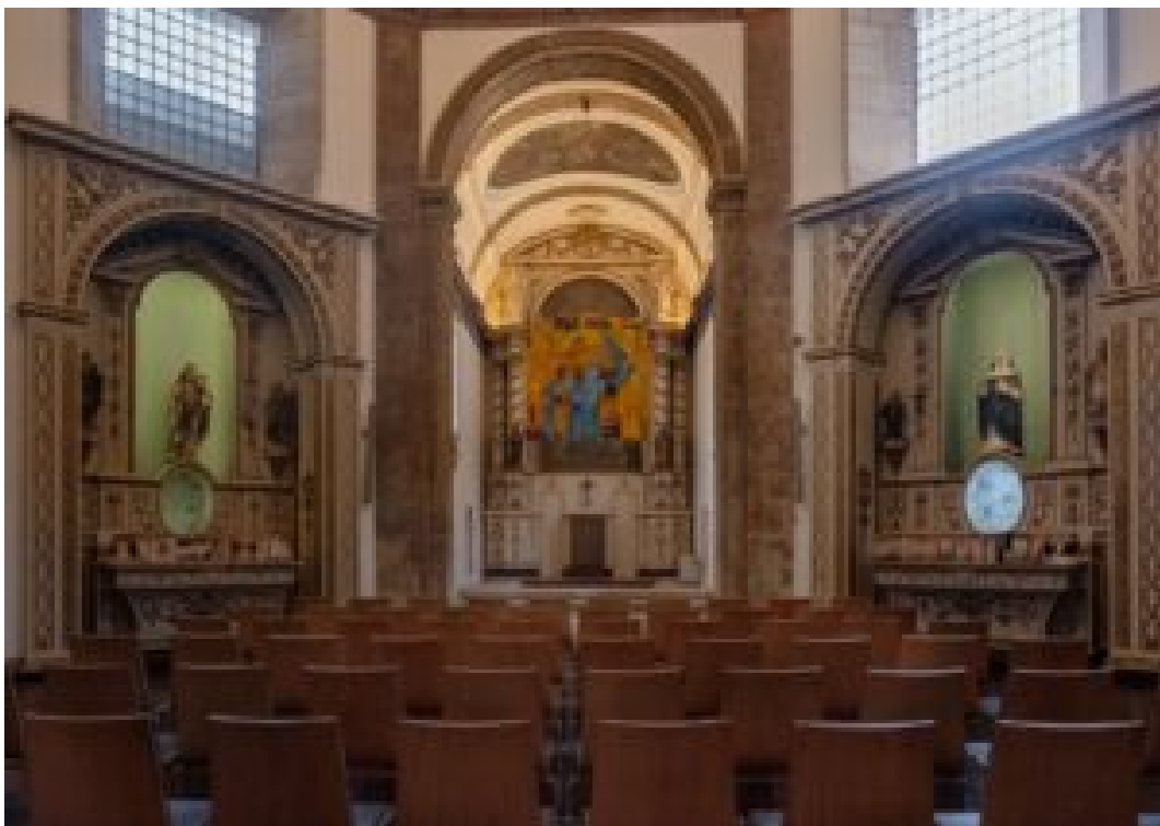
O INTERIOR DA IGREJA

O século XVII trouxe desafios inesperados. As constantes cheias do Douro forçaram uma reconstrução que mudaria para sempre a face do convento. Foi então que surgiu a igreja atual, com a sua arquitetura pensada especificamente para a vida de clausura – o coro organizava-se de forma que as religiosas pudessem participar nos ofícios sem quebrar o isolamento do mundo exterior.