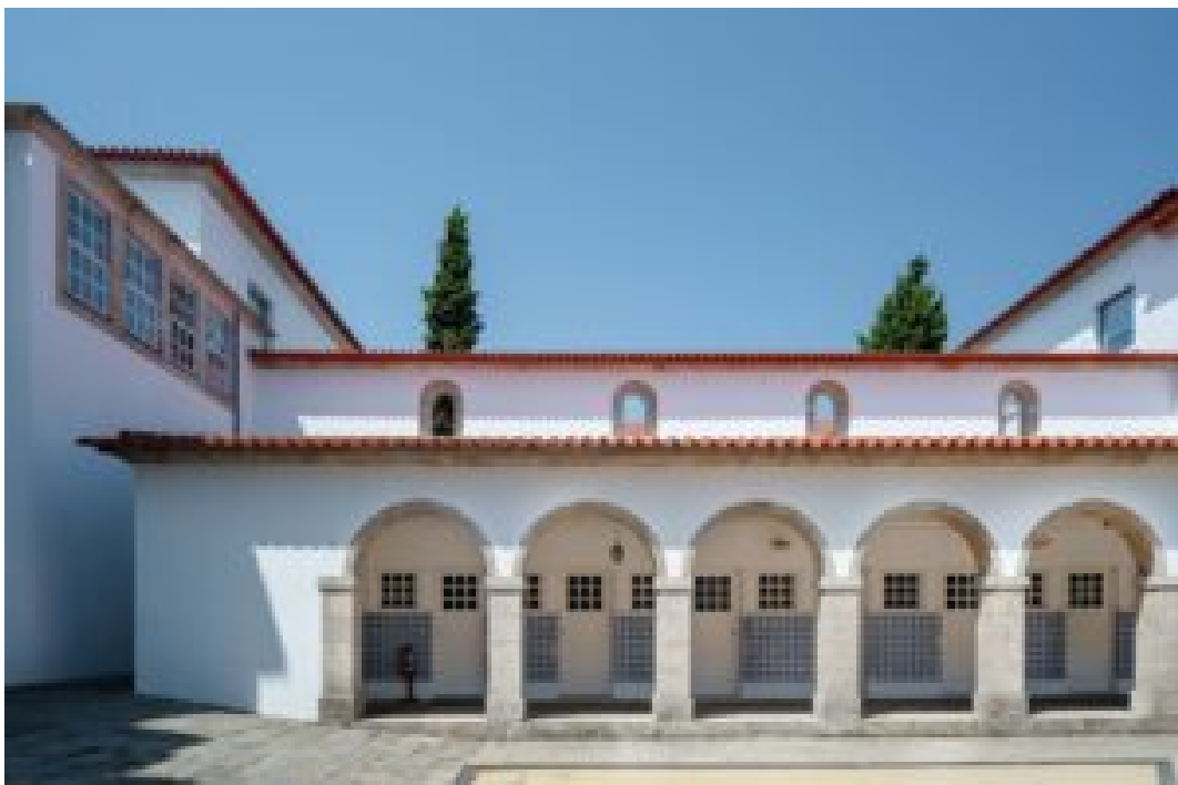
A ALA LATERAL NO EXTERIOR DO MONUMENTO