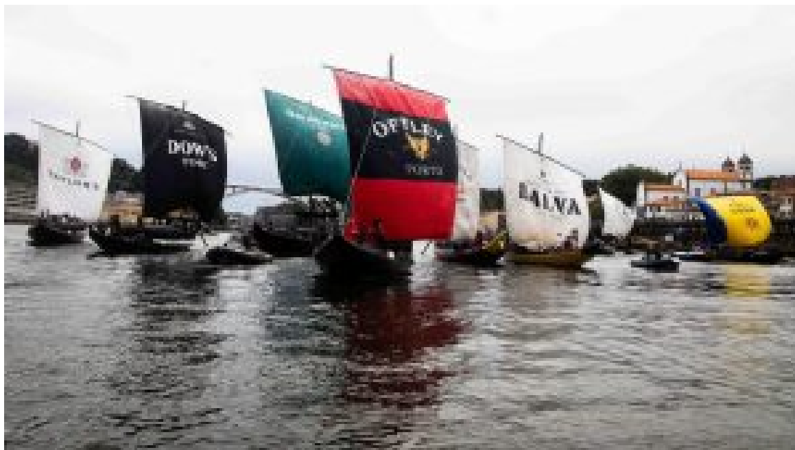
REGATA DOS BARCOS RABELOS DA CONFRARIA DO VINHO DO PORTO

evento único no mundo, onde as embarcações tradicionais que transportavam Vinho do Porto entre o Douro e as caves em Gaia competem amigavelmente numa corrida festiva. Esta prova celebra o Vinho do Porto e decorre no rio Douro, com partida do Cabedelo às 12h00 e chegada à ponte Luís I às 13h00.