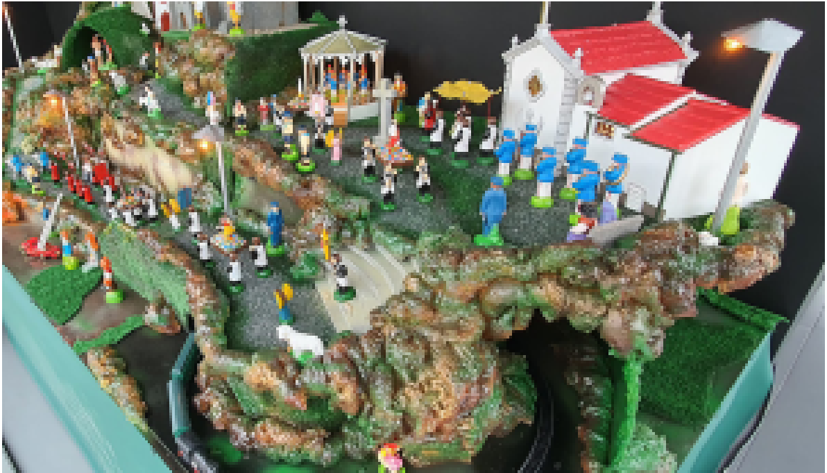
CASCATA DE JOAQUIM LEANDRO OLIVEIRA RAMOS, QUE ESTEVE EXPOSTA EM 2021 NA LOJA INTERATIVA DE TURISMO DE GAIA

Quanto ao lançamento de balões, nesta noite especial, será permitido entre as 21.45 horas do dia 23 até à 1.01 horas do dia 24, segundo anunciou a Câmara do Porto.