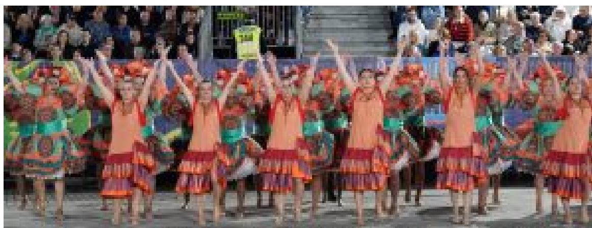
MARÇA DE ARCOZELO VENCEU O CONCURSO DE MARCHAS SÃOJOANINAS GAIA 2025

O São João é a maior festa popular da região, celebrada na noite de 23 de junho e na viragem para 24, feriado municipal em ambas as cidades. Uma celebração genuína, autêntica, de espírito comunitário e colaborativo que une e reúne gente boa, muito boa, de todas as idades em torno de uma tradição secular. Uma festa inspiradora, de afetos e de alegria!