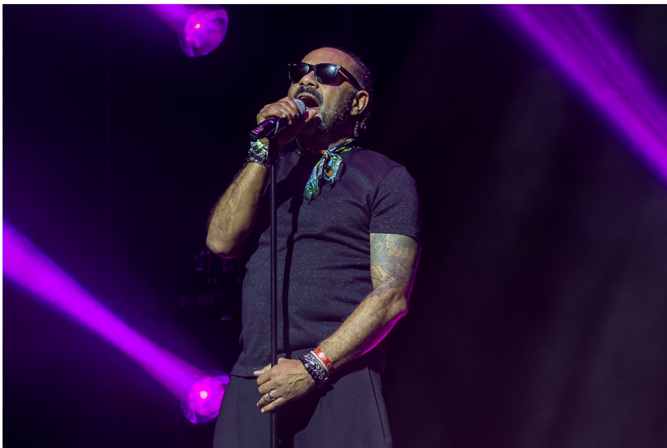
Olavo Bilac (voz).