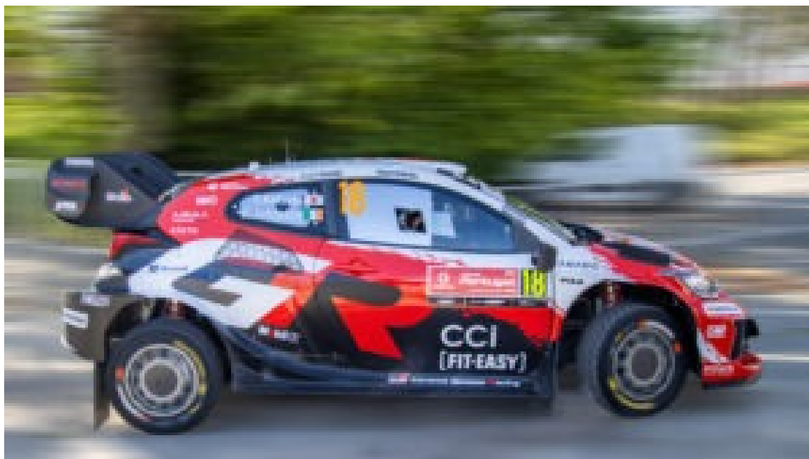
Rally de Portugal – Shakedown de Baltar.

Com o sol a pôr-se sobre o parque de assistência, o ambiente é de “calma antes da tempestade” . Os pilotos aproveitam as últimas horas para o estudo das notas de ritmo, enquanto os mecânicos garantem que, ao amanhecer, cada carro estará no auge das suas capacidades para enfrentar um dos ralis mais exigentes do calendário mundial.