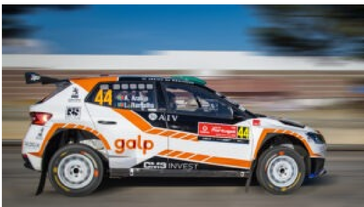
Rally de Portugal – Shakedown de Baltar.

As equipas de assistência enfrentam agora uma noite de trabalho intensivo para converter as configurações de treino no “set-up” final de prova.