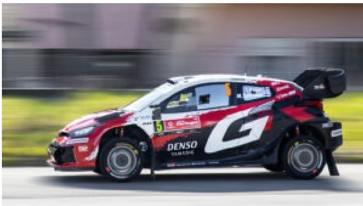
Rally de Portugal – Shakedown de Baltar.

condições reais de prova, a caravana do Vodafone Rally de Portugal recolheu ao parque de assistência na Exponor para as verificações finais antes do arranque oficial.