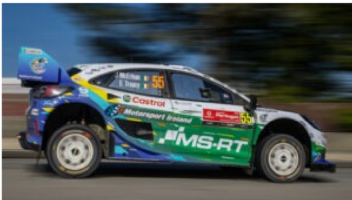
Rally de Portugal – Shakedown de Baltar.

O Shakedown de Baltar marcou o primeiro teste de fogo para a fiabilidade mecânica das novas configurações de 2026.