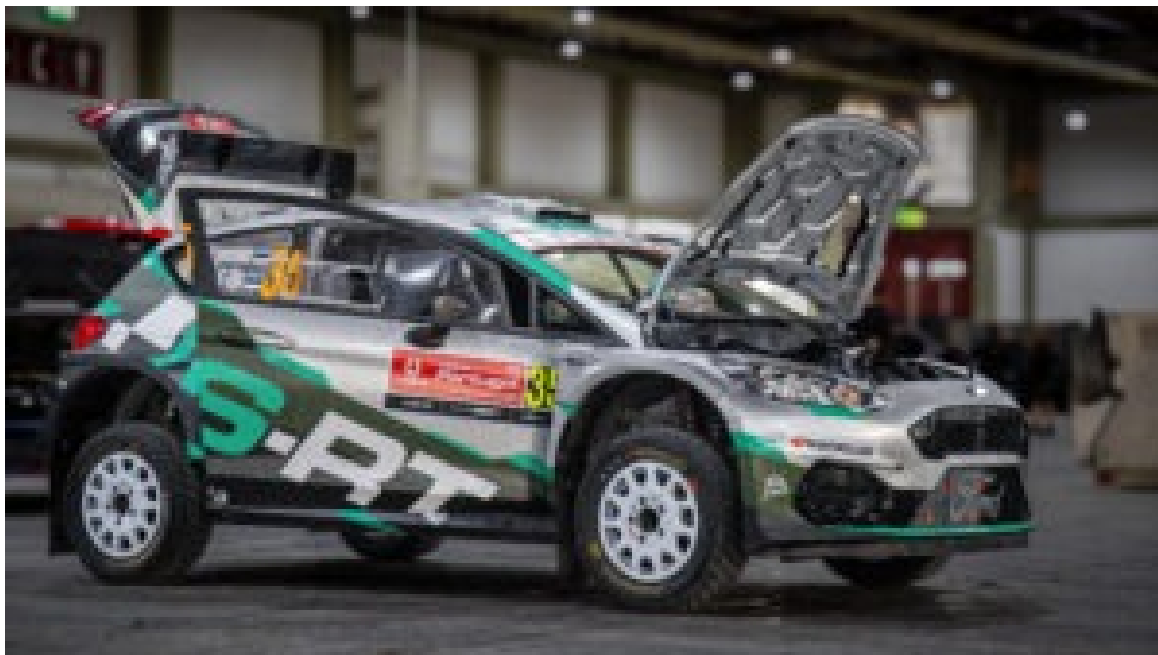
Rally de Portugal – Exponor.