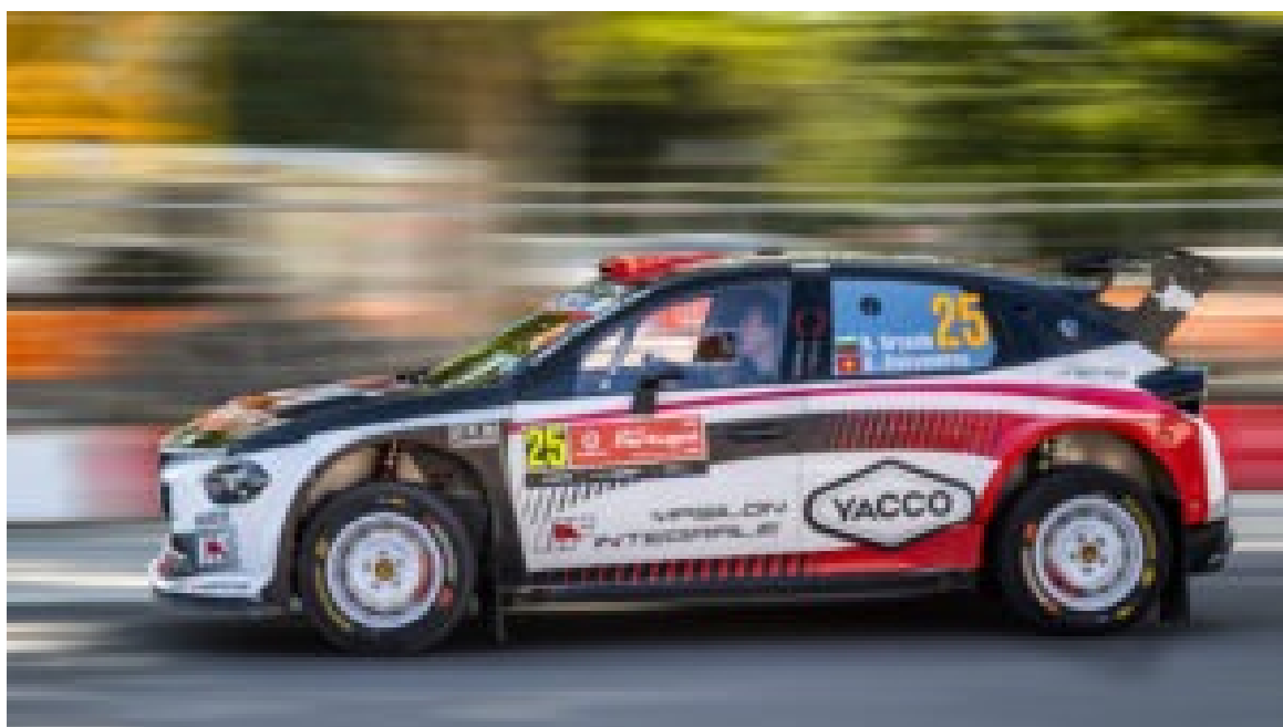
Rally de Portugal – Shakedown de Baltar.

As imagens captadas à chegada revelam o estado das máquinas após o primeiro contacto com o pó e a gravilha do norte do país: