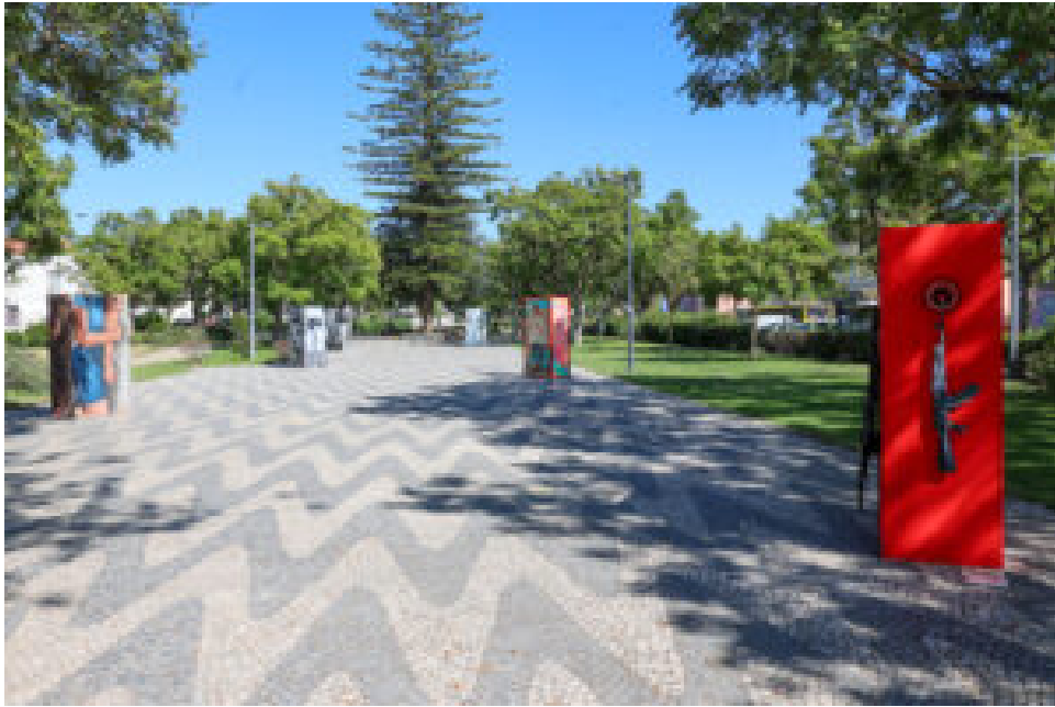
Seis totens artísticos – Rememoração – na avenida Luísa Todi.