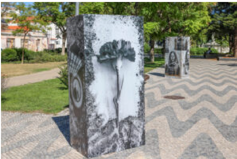
Seis totens artísticos – Rememoração – na avenida Luísa Todi.