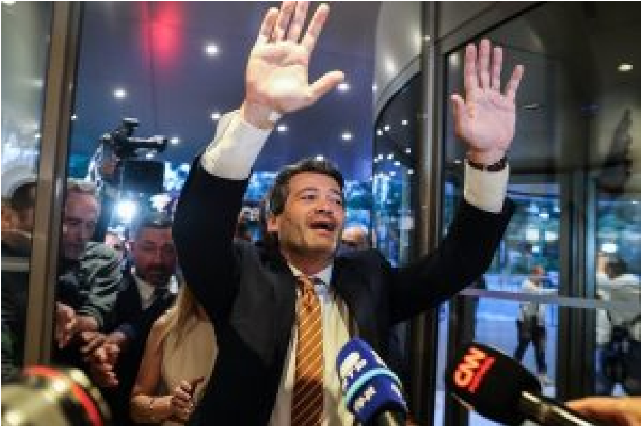
ANDRÉ VENTURA (CHEGA) – 22.56% | 58 ELEITOS

O presidente do Chega, André Ventura, considerou que o partido teve uma “grande noite” e tornou-se “o segundo maior partido” nas eleições legislativas de domingo, representando o fim do bipartidarismo .