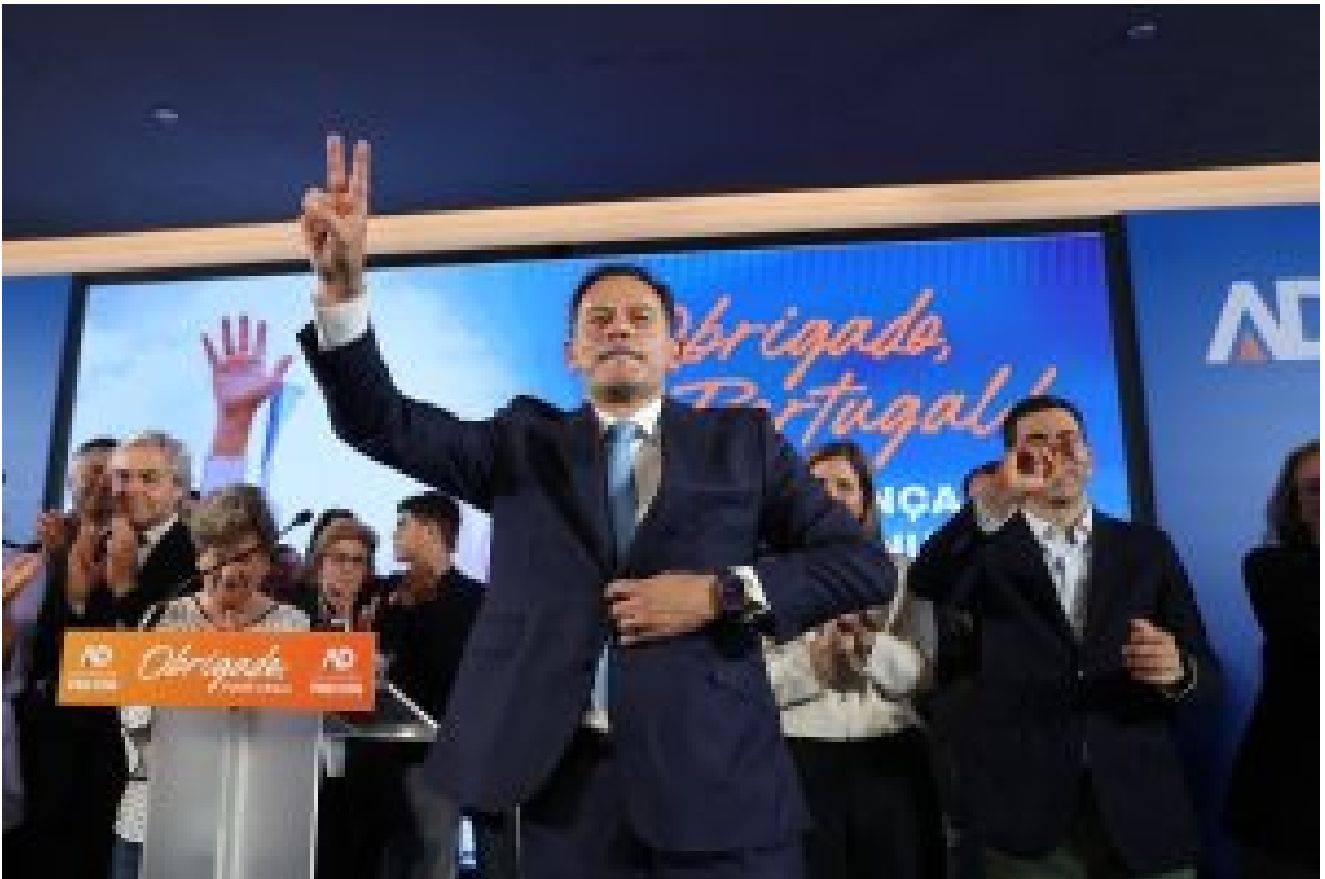
LUÍS MONTENEGRO (ad) – 32.10% | 86 ELEITOS

“O povo falou e exerceu o seu poder soberano. No recato da sua liberdade, aprovou, de forma inequívoca, um voto de confiança no Governo, na AD e no primeiro-ministro”, declarou, recebendo uma prolongada salva de palmas.