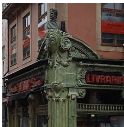
Livraria Latina no Porto vai encerrar.