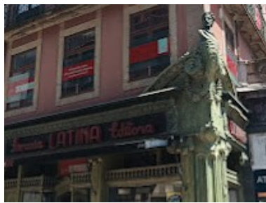
Livraria Latina, Porto.

A Livraria Latina foi a primeira empresa em Portugal a criar um concurso literário, logo no ano da sua inauguração. O vencedor do mesmo foi o Prof. José Hermano Saraiva que concorreu com a obra “Vento vindo dos montes” usando o pseudónimo Simplicimus.