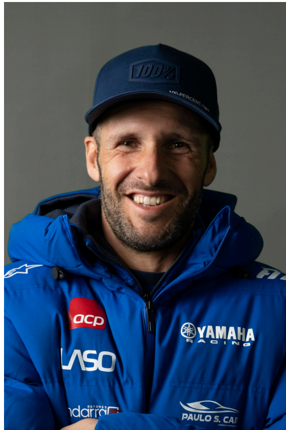
António Maio. Direitos Reservados

Foram realizados 476 quilómetros, dos quais 131 disputados ao cronómetro. Aos comandos da sua Yamaha Ténéré , o heptacampeão nacional completou a etapa com o 8º tempo absoluto, sendo 6º da classe +650cc. Na classificação desta 17ª edição da mítica maratona africana de todo-o-terreno o piloto português terminou em 5º lugar da classe +650cc e na 6ª posição da classificação geral.