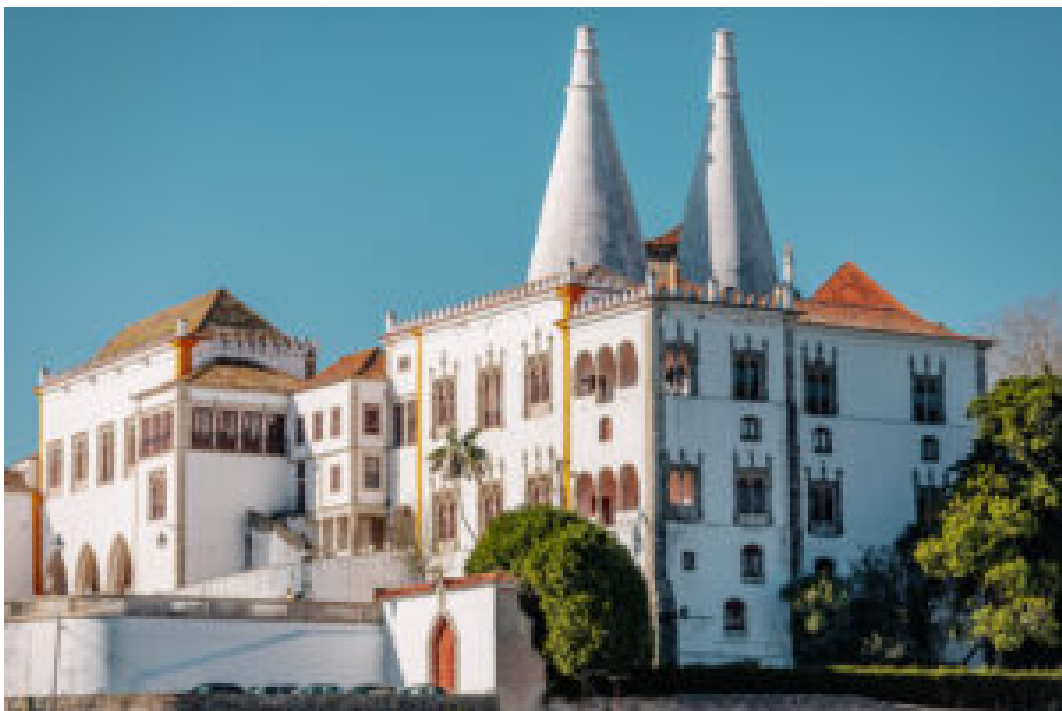
Palácio Nacional de Sintra.

Desde 1993 – ano em que foram criados –, os World Travel Awards têm premiado a excelência em todos os ramos da indústria do turismo e converteram-se num selo de qualidade reconhecido a nível global.