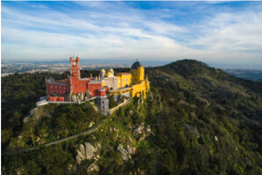
Parque e Palácio Nacional da Pena.

Desde 1993 – ano em que foram criados –, os World Travel Awards têm premiado a excelência em todos os ramos da indústria do turismo e converteram-se num selo de qualidade reconhecido a nível global.