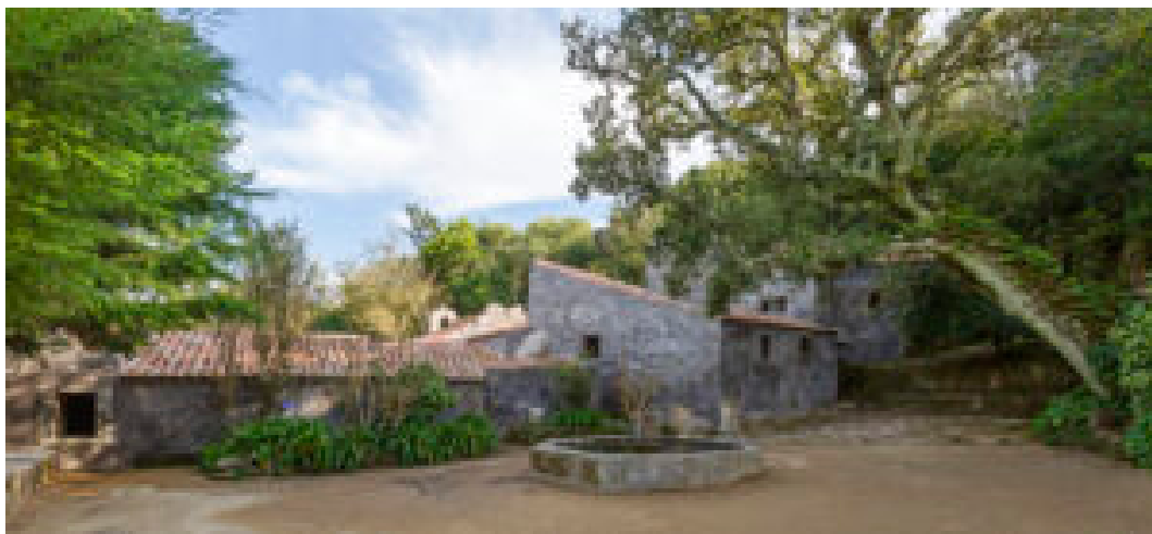
Convento dos Capuchos.

plataforma, fazer login para validar o seu voto. Se não estiver registado, terá de fazer o registo e depois validá-lo clicando no link enviado para o seu email. Só após este passo, o seu voto será contabilizado.