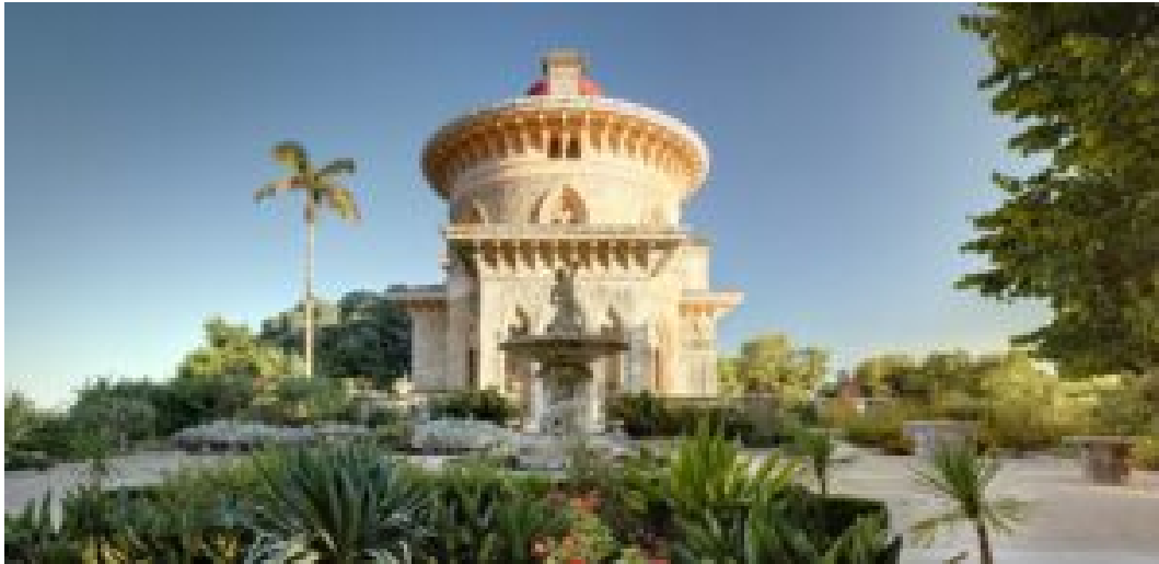
Palácio de Monserrate.

As votações para a 32ª edição dos “World Travel Awards” são abertas tanto aos profissionais do turismo, como ao público em geral, e já estão a decorrer no site oficial da organização até ao final do dia 26 de outubro.