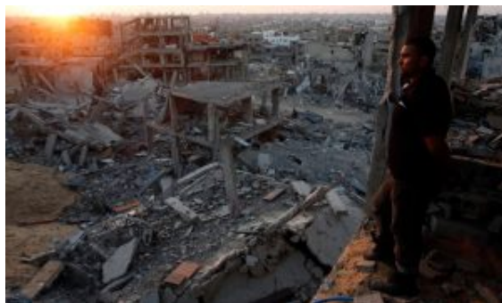
Gaza. Direitos Reservados

Aquando do atroz ataque do Hamas a 7 de outubro de 2023, todos nos unimos em (quase) uníssonos e reconhecemos a barbárie que havia sido cometida. Milhares de pessoas haviam sido assassinadas, na sua maioria civis. O Hamas mostrava, com orgulho, os requintes de malvadez com que tinha cometido aqueles crimes indefensáveis.