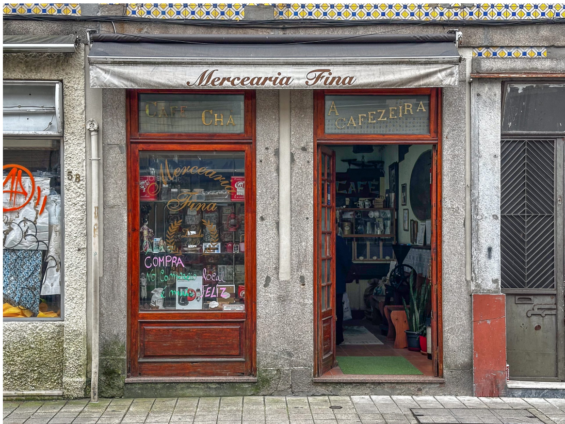
A Cafezeira.