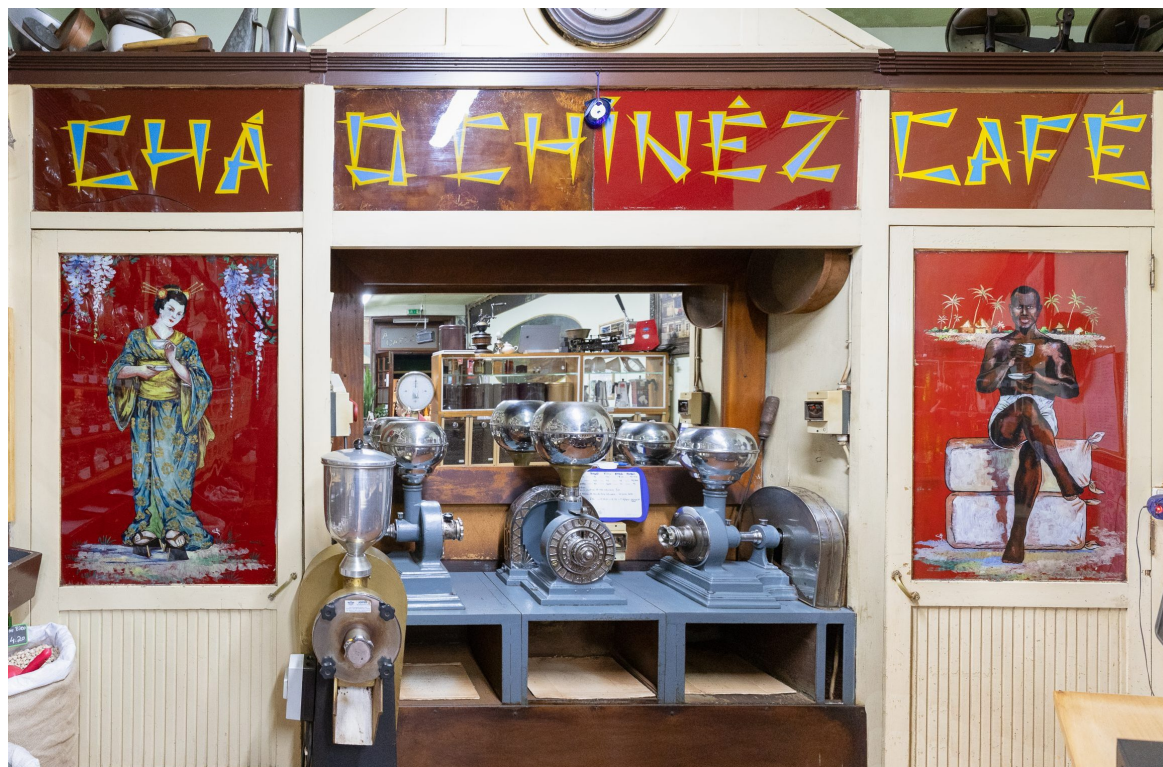
O Chinês.