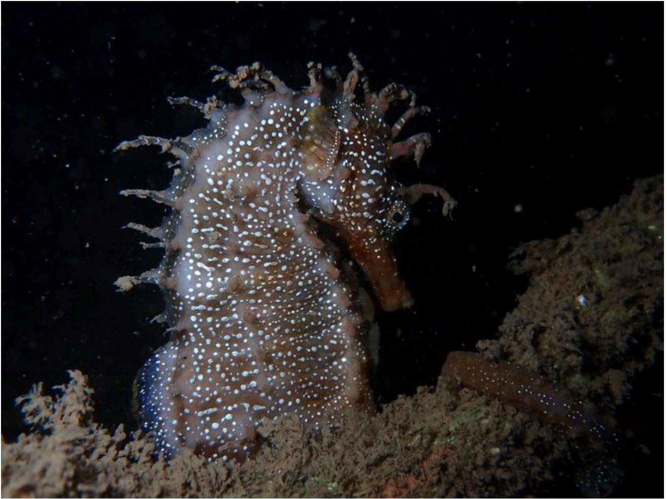
Cavalo Marinho.

A iniciativa prevê ações de restauro ecológico que pretendem salvaguardar os ecossistemas e espécies ainda presentes no território nacional, bem como restaurar habitats degradados e promover a regeneração da biodiversidade , envolvendo a comunidade local e os cidadãos em geral. A Re-Store Portugal inclui ainda ações de educação ambiental junto das comunidades e uma campanha nacional de sensibilização para a causa do restauro ecológico.