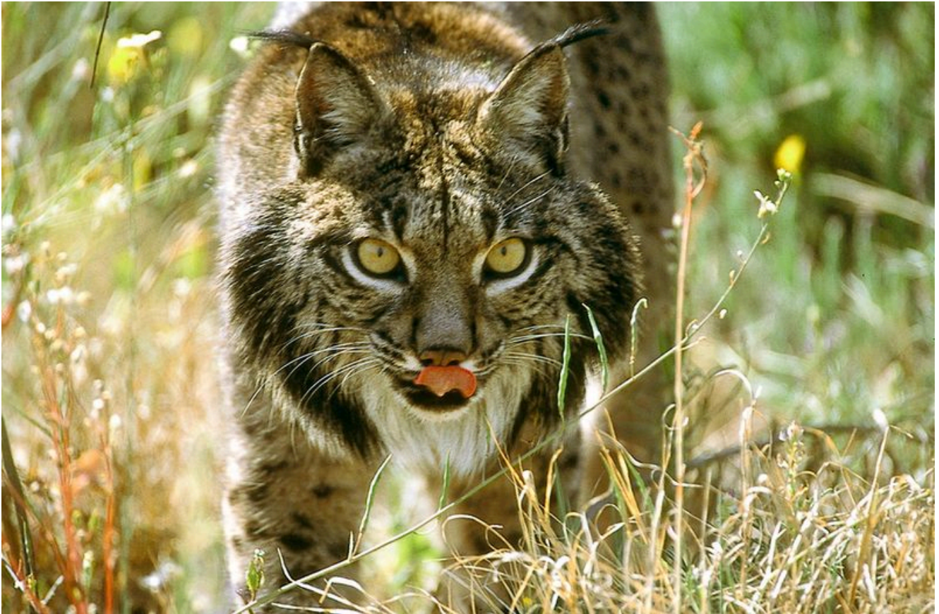
Lince Ibérico na Serra do Caldeirão.

“Restaurar a natureza é reforçar a infraestrutura natural do país – aquela que sustenta silenciosamente a nossa economia, a saúde pública e o bem-estar coletivo. Portugal tem tudo para liderar este esforço coletivo, se souber valorizar os seus recursos naturais com ambição e visão estratégica” , afirma Ângela Morgado, Diretora Executiva da WWF Portugal.