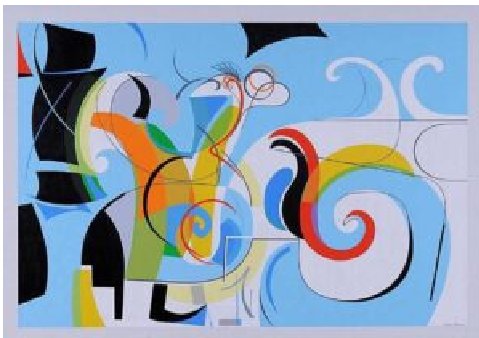
Gardénias de Nadir Afonso.

A comunicação dirigida aos flavienses apresenta o Museu como fonte de despesas públicas e não como uma mais-valia capaz de alavancar a cidade , um serviço público.