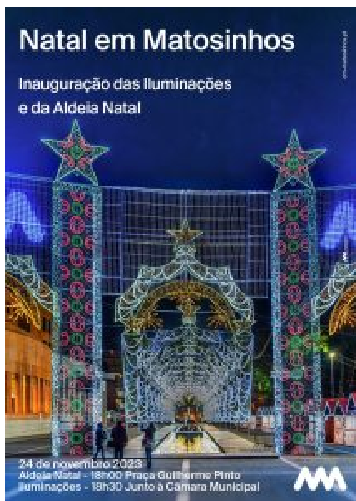
Natal em Matosinhos

Em Matosinhos: Depois da inauguração, a Praça Guilherme Pinto transformou-se numa Aldeia Natal encantadora. Poderá visitar este local de segunda a sexta-feira, das 15h às 20h , e aos sábados, domingos e feriados, das 11h às 21h . A programação é variada: como a Ópera de Bolso ou " Soldadinhos de Chumbo " em performances marcadas para 10, 16 e 22 de dezembro (sempre às 18h). Serão realizados espetáculos de Som e Luz , em frente à Câmara Municipal e na Praça Guilherme Pinto; a FAMA – Feira de Artesanato de Matosinhos , no Jardim Basílio Teles e um Concerto de Natal com Ensemble Vocal Pro Música: Harmonia no Ar – 16 de dezembro, às 21h30, a Igreja Matriz do Bom Jesus de Matosinhos, com entrada livre mas sujeita à lotação do espaço.