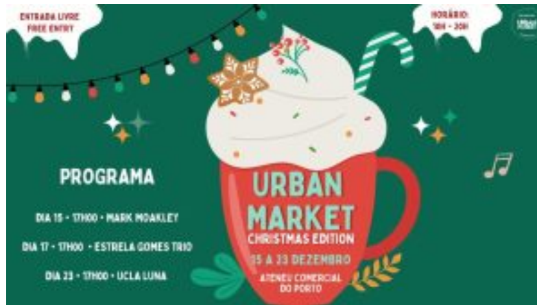
Urban Market – Ateneu Comercial do Porto