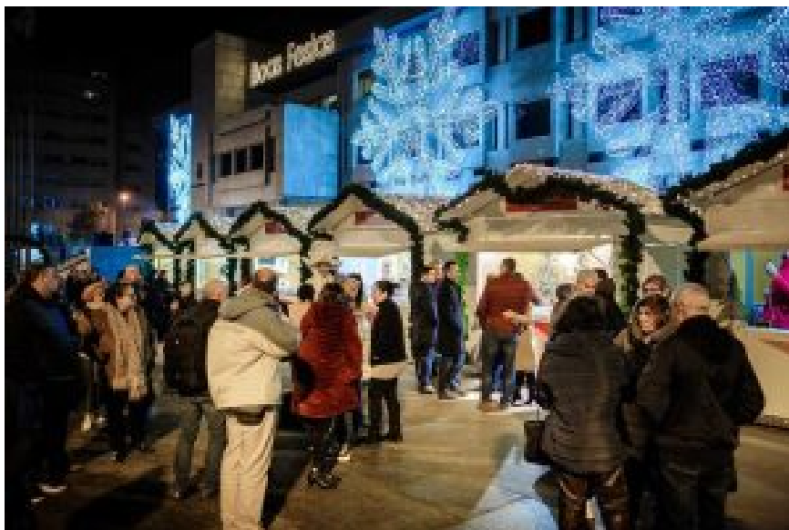
Mercadinho de Natal, Maia

Na Maia: Pista de gelo e Carrossel Parisiense e O Mercadinho de Natal, ambos na Praça Doutor José Vieira de Carvalho.