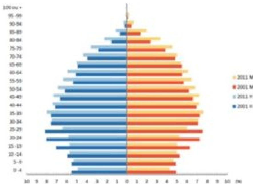
Gráfico nº 2-Estrutura etária e por sexos da população 2001– 2011

A questão demográfica desempenha um papel fundamental na sustentabilidade do sistema de pensões português e, como vemos no segundo gráfico, a evolução ao longo da última década tem vindo a ser feita no caminho do envelhecimento da população, o que acontece também por toda a Europa. Este status quo só poderá ser alterado com políticas ativas de apoio à família e à natalidade.