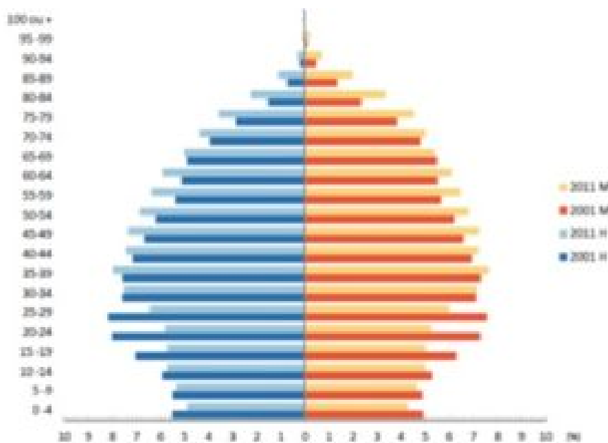
Gráfico nº 2-Estrutura etária e por sexos da população 2001- 2011

A questão demográfica desempenha um papel fundamental na sustentabilidade do sistema de pensões português e, como vemos no segundo gráfico, a evolução ao longo da última década tem vindo a ser feita no caminho do envelhecimento da população, o que acontece também por toda a Europa. Este status quo só poderá ser alterado com políticas ativas de apoio à família e à natalidade.