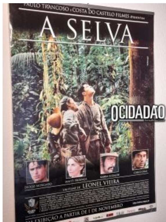
Cartaz do filme “A Selva”.