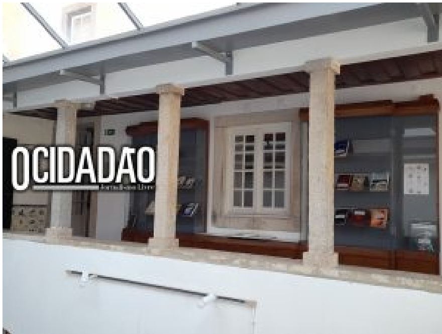
Casa Museu Ferreira de Castro, em Sintra.

O escritor pretendia, assim, permanecer eternamente ligado, de corpo e alma, à natureza que lhe inspirou centenas de páginas: “ficar perto dos homens, meus irmãos, e mais próximo da lua e das estrelas, minhas amigas, tendo em frente a terra verde e o mar a perder de vista – o mar e a terra que tanto amei” . Ferreira de Castro escreveu parte da sua obra tendo como fundo os cenários verdejantes de Sintra, ficando hospedado por longas temporadas no Hotel Netto.