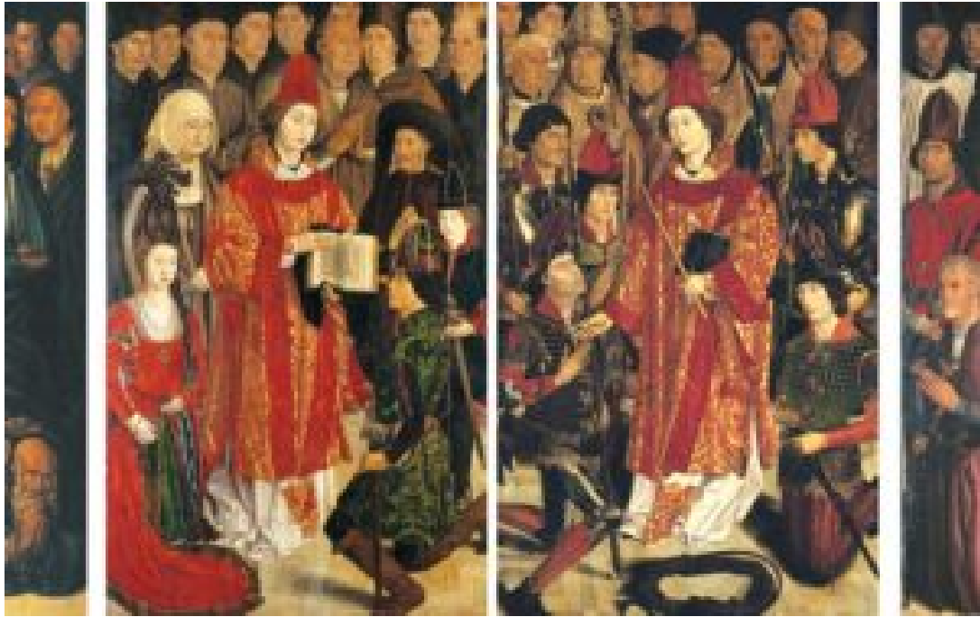
Painéis de São Vicente.