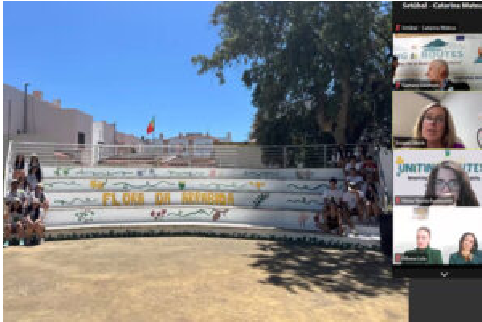
Encontro Uniting Routes.

Durante a sessão, os participantes, provenientes dos municípios que integram o Uniting Routes, exploraram o papel dos jovens na participação cívica e ambiental e de que forma a diversidade cultural pode impulsionar sociedades mais sustentáveis, alinhadas com os objetivos do Pacto Ecológico Europeu e da Agenda 2030 .