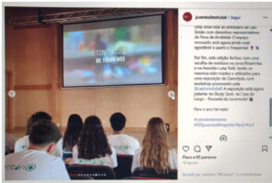
Encontro Uniting Routes. Direitos Reservados

A transformação de resíduos em arte, a requalificação de espaços públicos com a pintura de muros e a criação de jogos tradicionais, ações de limpeza e de sensibilização ambiental na Praia de Albarquel e uma aposta no combate ao desperdício alimentar, que incluiu a confeção de refeições “desperdício zero”, foram as iniciativas do Conscente(mente) abordadas no workshop.