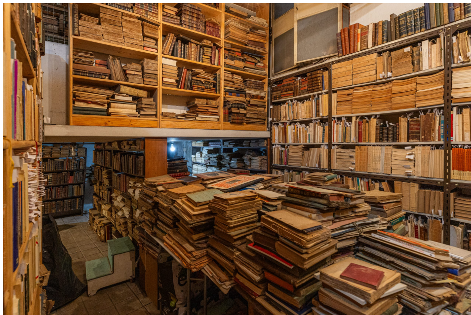
Cave da Livraria.

Felizmente os livros têm sobrevivido. Mesmo perante a era digital há sempre quem prefira o livro em papel. Por vezes é uma escolha inconsciente. Pode ser pelo prazer de folhear, pela ligação afetiva a esse objeto mágico, pelo odor que transporta... e há mesmo aqueles que entre todos os livros possíveis, preferem os livros antigos. O prazer de adquirir algo com história. A possibilidade de imaginar as vidas dos proprietários, o modo como se relacionaram com ele, as viagens imaginárias que cada um lhes permitiu realizar... Ou tão só, o poder e o prestígio obtidos ao conseguir uma edição antiga, algo raro com valor económico ou sentimental, ou apenas pelo próprio hobby do colecionismo... há um certo culto do livro, esse objeto desejado que se quer possuir e mostrar. Um culto onde há vaidade e investimento! Mas há também amor, Miguel reitera “diz-se que a filosofia é amor à sabedoria. E uma livraria, os livros, são o amor ao conhecimento” .