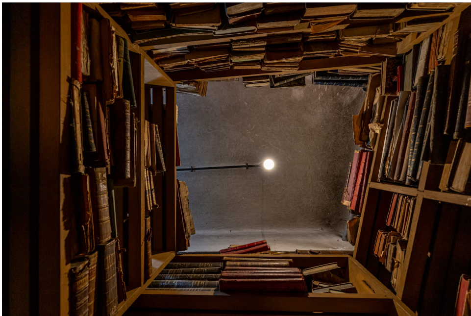
Cave da Livraria.

Descer à cave da livraria, é um privilégio, não acessível ao público em geral. É iniciar uma viagem interminável pela literatura e conhecimento intergeracional sob a forma de livro. Há de tudo um pouco, desde obras de teologia, filosofia, direito, história...literatura francesa, inglesa e até edições em Latim! Olhar para estes livros empilhados ou alinhados, uns mais organizados outros completamente enleados em confusa vizinhança, é também perceber as suas vidas e as dos seus sucessivos proprietários.