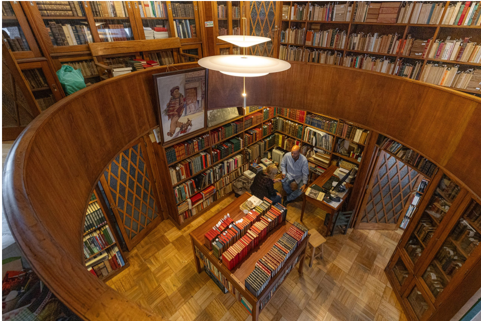
Livraria Moreira da Costa (Filha).

porque no fim 12º segundo ano fiquei aqui a trabalhar com a minha avó. Ela já tinha uma idade avançada e decidi ficar aqui a trabalhar. Uma escolha por vontade própria, pelo gosto e amor aos livros e pelo gosto de conversar com as pessoas bem como pelo conhecimento que com elas adquiria”.