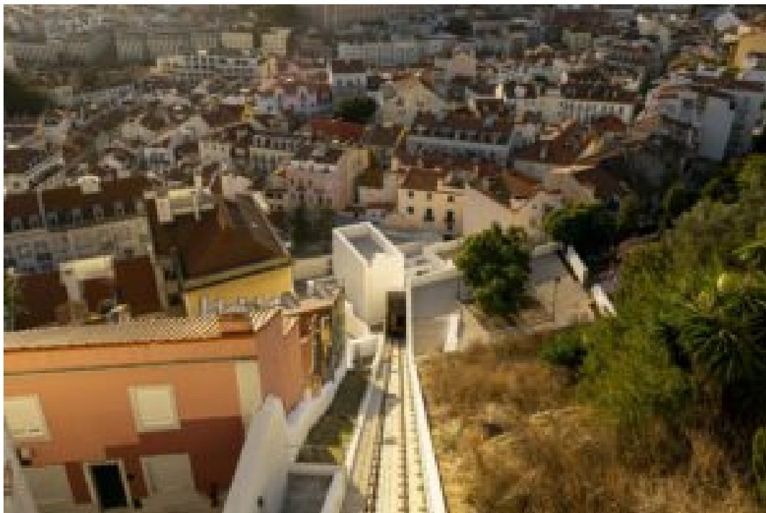
Funicular da Graça. Direitos Reservados

Passado seis meses do acidente, a comissão técnica independente concluiu o parecer técnico referente ao funicular da Graça e “o relatório confirma as boas condições estruturais e operacionais do equipamento” , indicou a Carris.