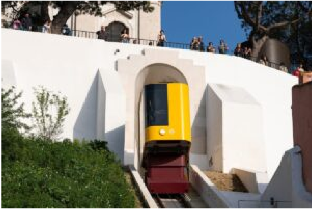
Funicular da Graça. Direitos Reservados

Na sequência do descarrilamento do elevador da Glória, que ocorreu no dia 03 de setembro e provocou 16 mortes e mais de 20 feridos, entre portugueses e estrangeiros de várias nacionalidades, a Câmara Municipal de Lisboa suspendeu “de imediato” o funcionamento dos ascensores da Bica e do Lavra e do funicular da Graça para os equipamentos serem inspecionados.