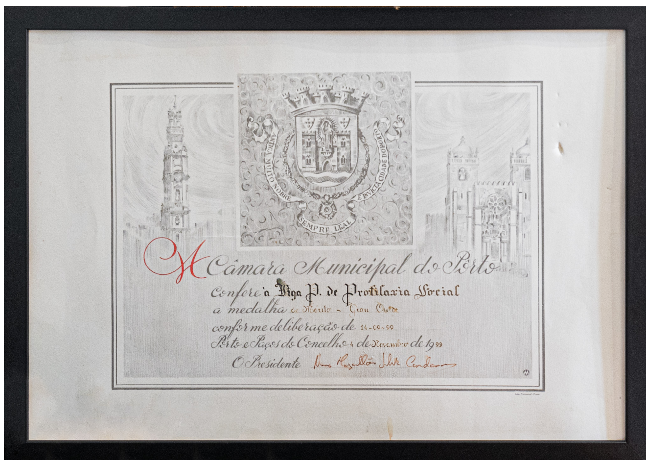
Medalha de Mérito – Grau Ouro.