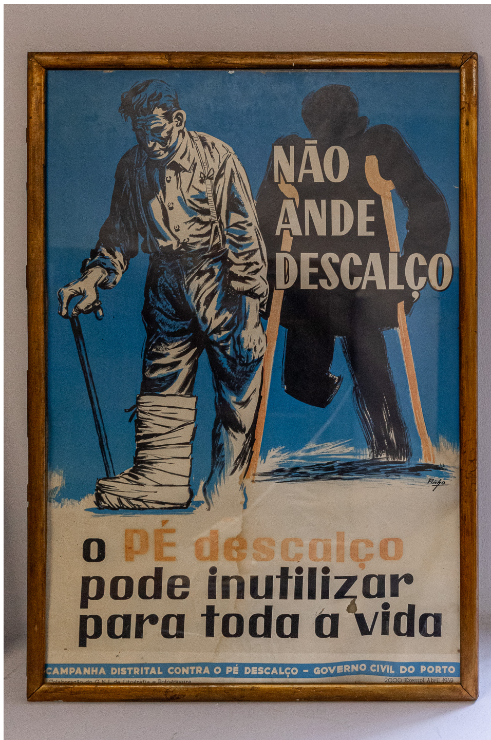
Campanha contra o Pé Descalço.

Uma das primeiras campanhas foi efetivamente a Campanha das Carquejeiras. Como nos referiu Edite Silva "no fundo foi uma campanha em que a Liga lutou junto das entidades políticas e afins para a erradicação desta profissão, pois, as mulheres vinham com uma carga imensa às costas pela calçada da Corticeira, uma calçada íngreme, talvez até uma das calçadas mais íngremes aqui da cidade. Elas vinham com uma carga de