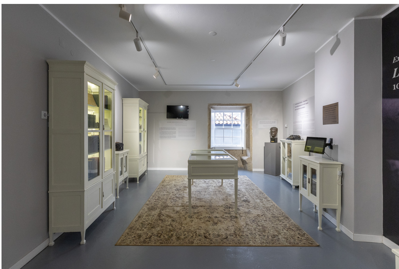
Espaço histórico.

Não obstante as vicissitudes e dificuldades económicas, a Liga manteve sempre uma profícua intervenção médico-social, constituindo-se em nome incontornável na defesa da saúde pública no século XX. Esta militância pela profilaxia foi exercida quer junto das populações quer das autoridades políticas, de modo a influenciar o legislador em matérias de saúde pública e da intervenção social.