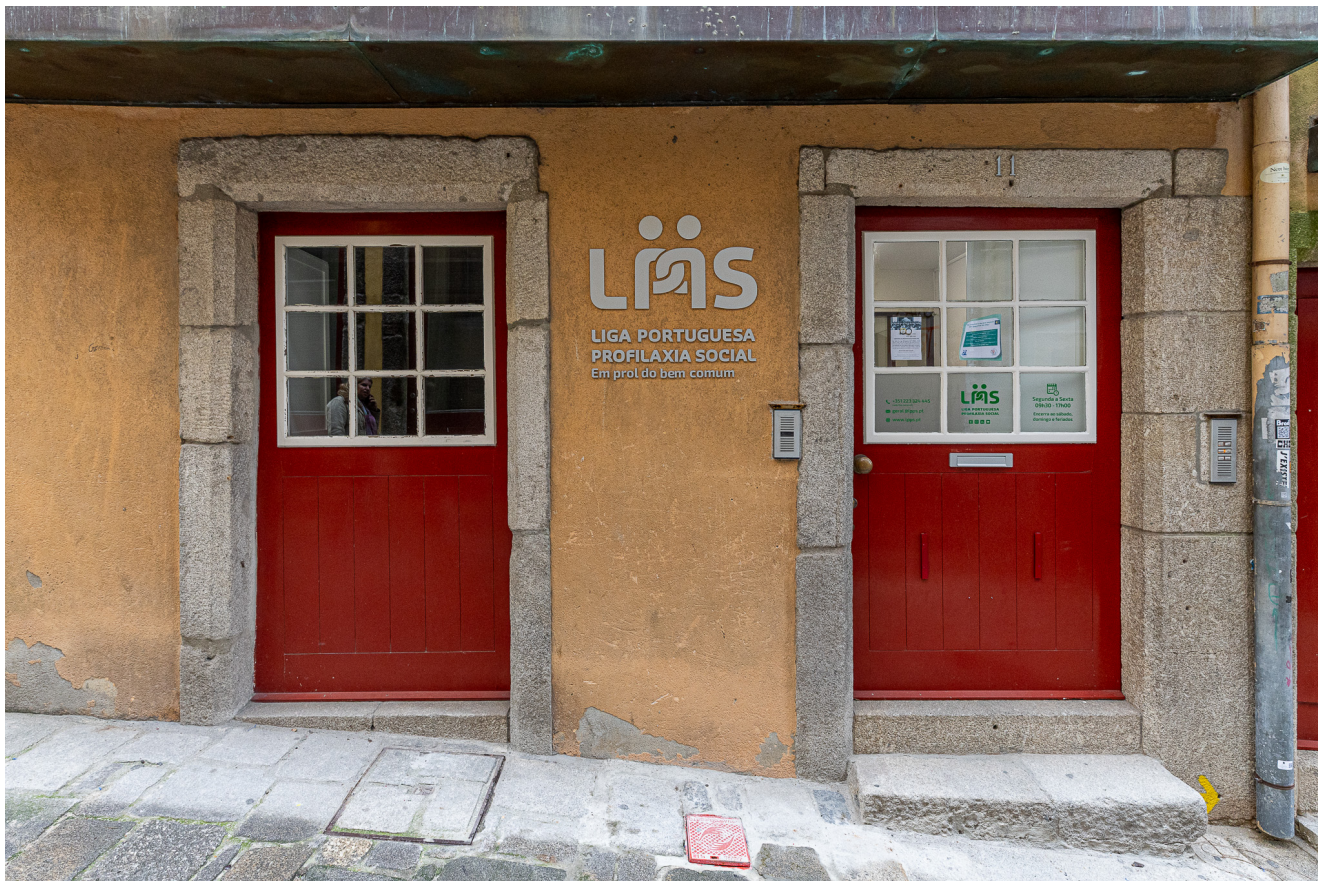
Liga Portuguesa de Profilaxia Social.

Passaram-se cem anos desde a fundação da Liga. Uma instituição que foi pioneira na saúde pública em Portugal, tendo mesmo antecedido a rede de dispensários de higiene social criados por Ricardo Jorge. O seu papel ao longo do tempo tem sido determinante ao nível preventivo, de intervenção médica e de preocupação com questões sociais e de saúde pública. No entanto, a Liga teve de ser instituída com verbas dos próprios fundadores e com o apoio de beneméritos, pois, não conseguiu apoio do Estado. Sem sede própria até aos nossos dias, atuava a partir dos consultórios dos fundadores na Rua de Santa Catarina, no 2º andar do nº 108, por cima do icónico Café Magestic.