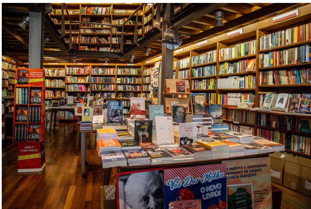
Interior da Livraria Latina.

O duro desfavor, que me condena, Quando pela memória se reparte, Endurece os sentidos de tal arte Que a dor da ausência fica mais pequena.