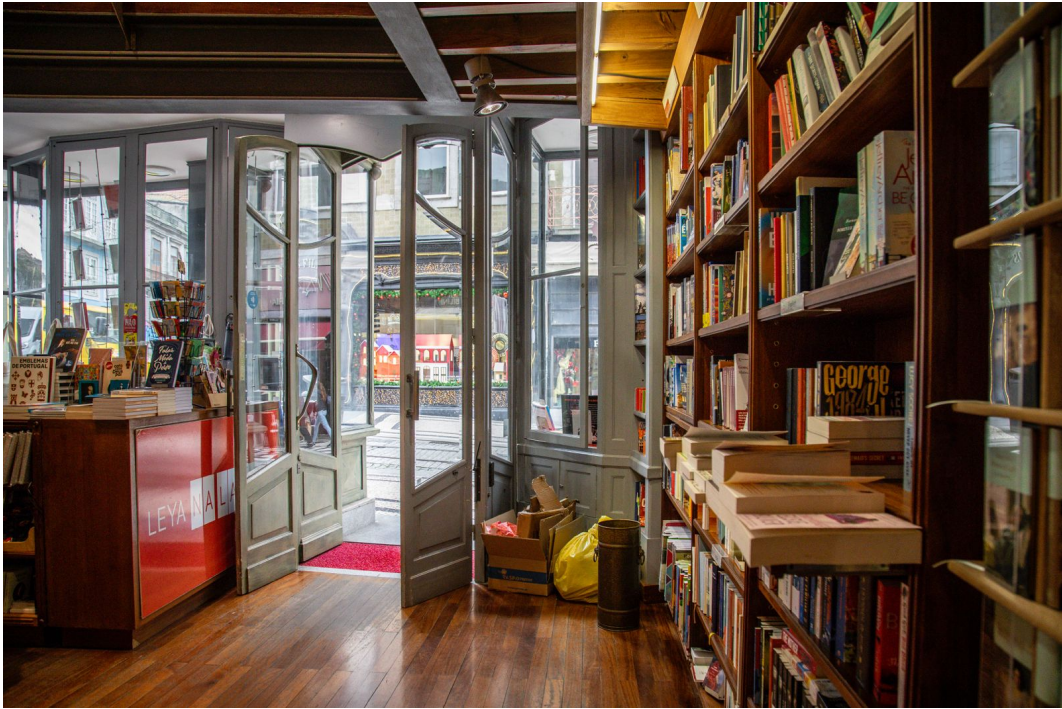
Vista do interior para o exterior e as portas ainda abertas.