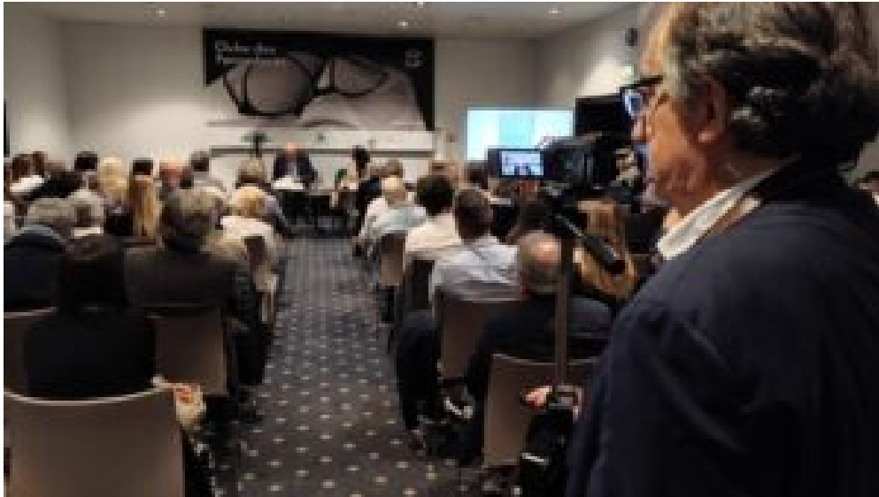
Auditório repleto para ver e ouvir o autor.

Para o autor, os encontros do Clube dos Pensadores sempre se distinguiram pela informalidade direta: “Qualquer pessoa faz uma apresentação de um livro às seis e meia... Aqui não.”