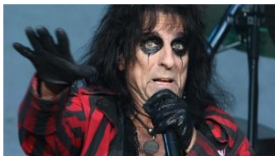
Alice Cooper (Vincent Fourier)

Influenciado pelas cenas psicadélicas e o art rock ( usa mais teclado que guitarra e temas filosóficos nas suas letras ) surge o Glam Rock . Associados aos nomes de David Bowie, Alice Cooper, Elton John e Roxy Music .