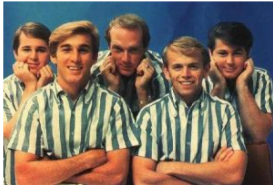
The Beach Boys

Beatles lançaram o álbum “ Revolver ” onde esta influência também se manifesta, o LP “ Pet Sounds ” dos Beach Boys é a “resposta” do outro lado do oceano (EUA).