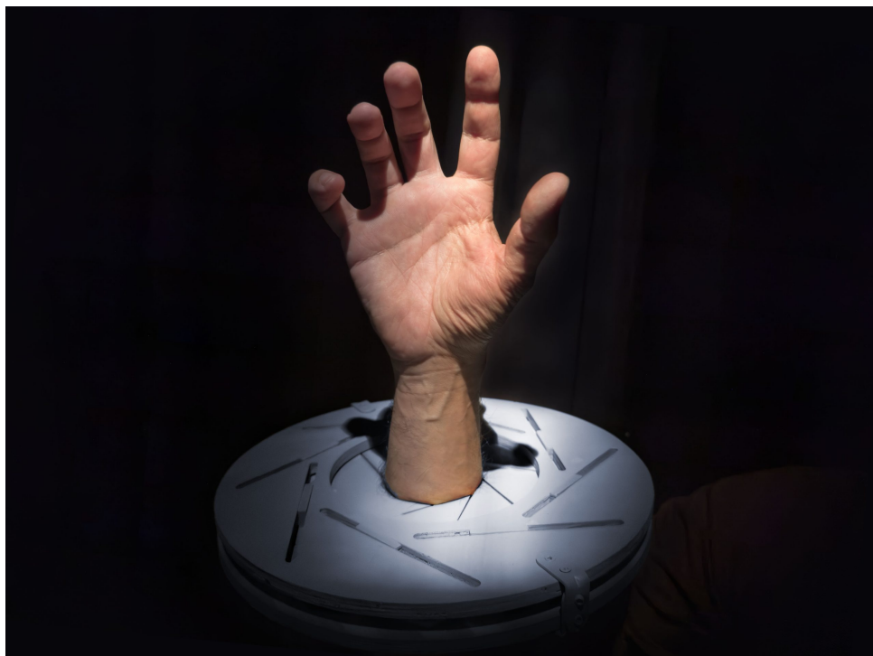
Capital Canibal – Sonoscopia & Teatro de Ferro

elemento novo – a inteligência artificial, que recolhe e recicla tudo o que vamos produzindo.”