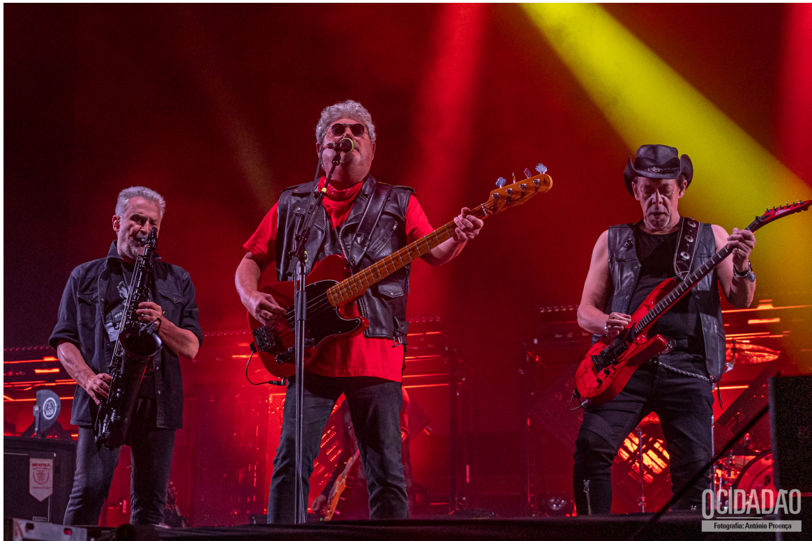
XUTOS & PONTAPÉS

Para encerrar a noite, os britânicos The Cult , com o seu estilo que mistura pós-punk e hard rock, liderados pelo carismático Ian Astbury, subiram ao palco, incendiando os festivaleiros com uma mistura envolvente de clássicos e músicas mais recentes. A presença cénica imponente de Astbury, combinada com os riffs marcantes de Billy Duffy, criaram uma atmosfera eletrizante, fazendo o público vibrar do início ao fim, mostrando que continuam a ser uma das forças mais respeitadas do rock. [ ALBUM FOTOS ]