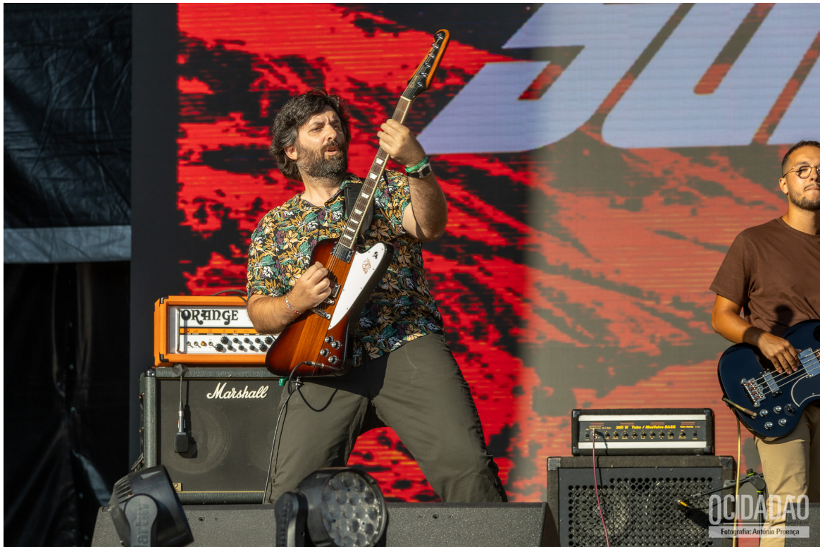
SULFUR GIANT

Contribuindo para a diversidade sonora do festival chegou a vez de Capitão Fausto , uma das principais forças do indie rock português. Com um alinhamento que incluiu os seus maiores sucessos, a banda cativou o público com sua sonoridade única que mistura influências do rock clássico com um toque moderno e psicadélico, [ALBUM FOTOS]