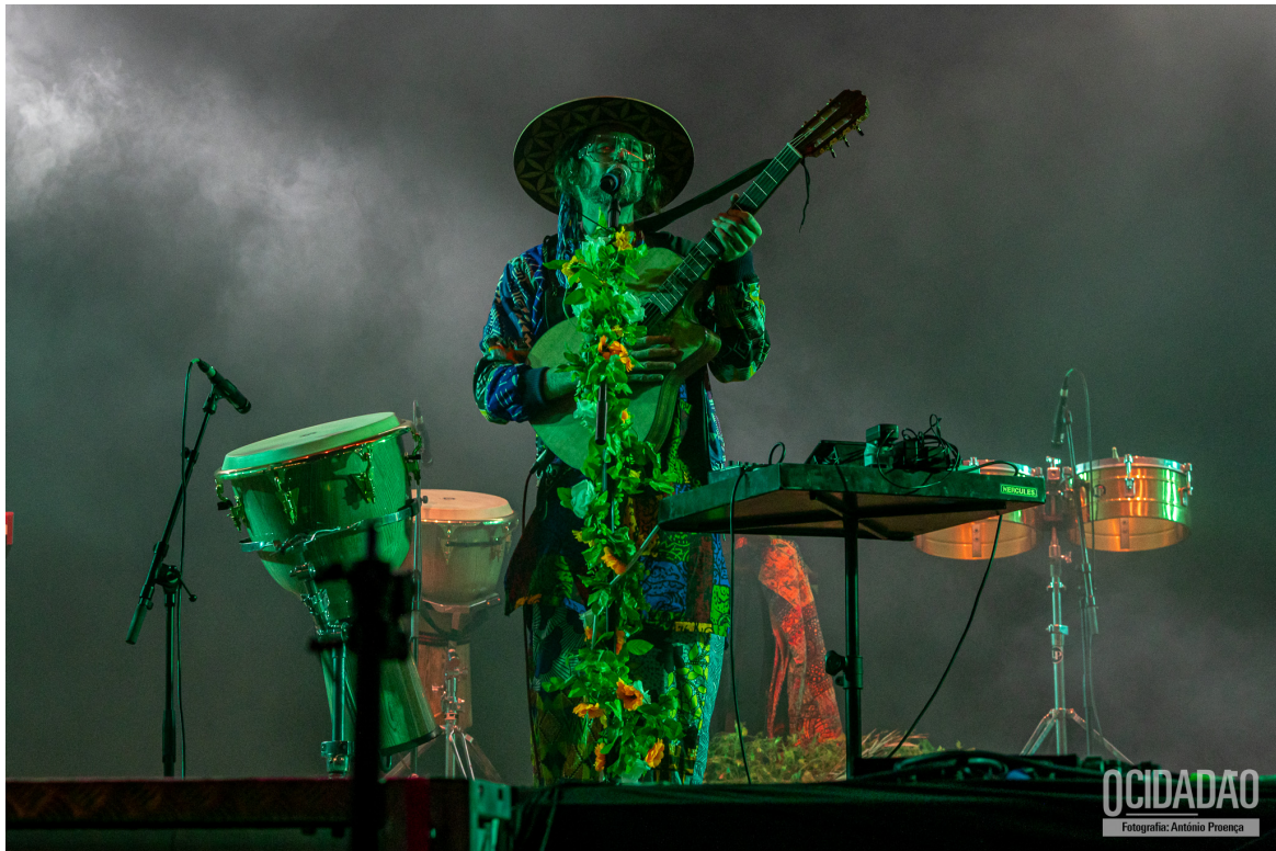
CRYSTAL FIGHTERS

Os icónicos portugueses Ornatos Violeta , honra lhes seja feita, trouxeram nostalgia com as suas músicas revisitando clássicos que marcaram uma geração. O grupo, que marcou profundamente o rock alternativo português dos anos 90, apresentou-se diante de uma multidão que aguardava ansiosamente pelos seus êxitos. A presença marcante de Manel Cruz no palco, com sua voz inconfundível e interpretações intensas, destacou-se como um dos pontos altos do festival proporcionando aos fãs mais jovens a oportunidade de vivenciar a energia e a magia que a banda sempre trouxe aos palcos [ALBUM FOTOS]