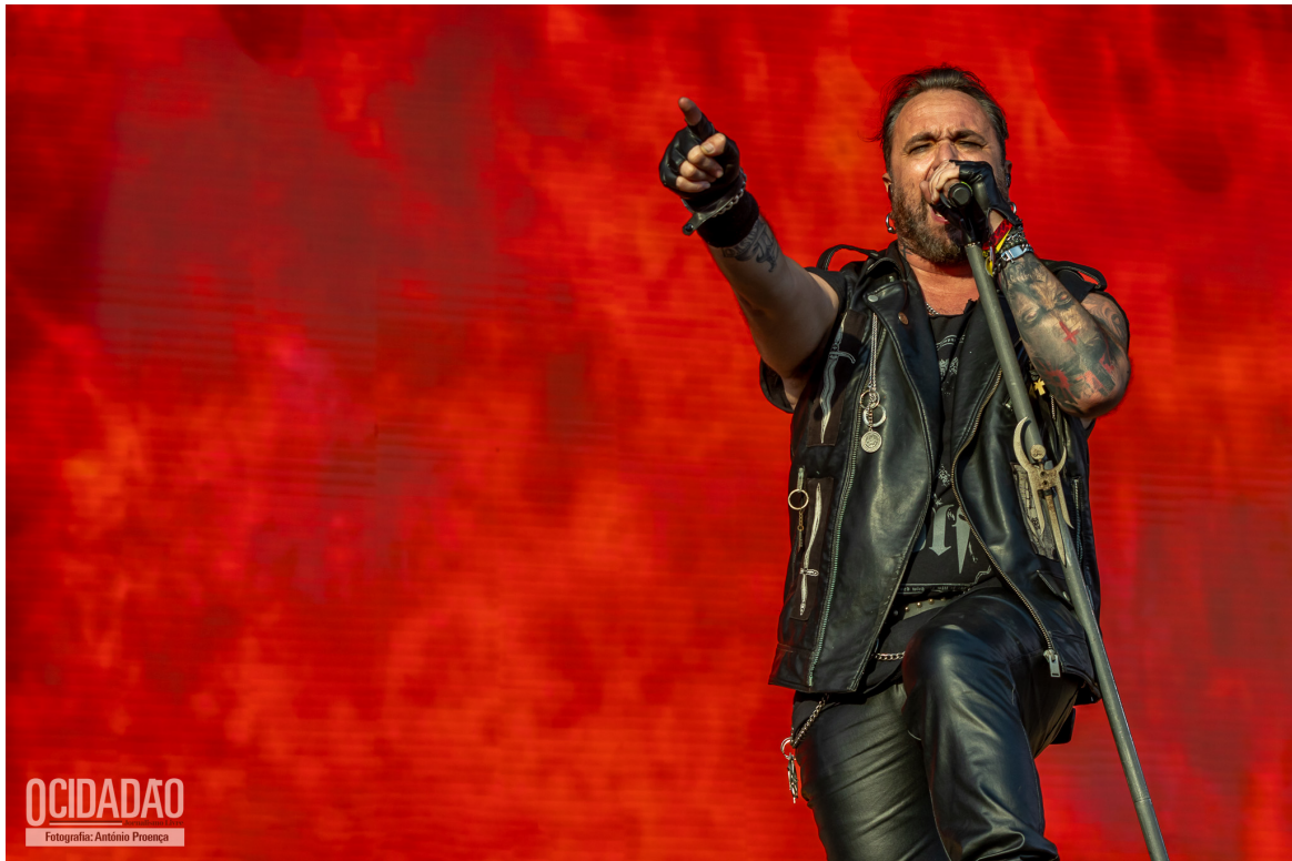
MOONSPELL

Logo depois, o público foi agitado pela banda norte-americana Soulfly , liderada pelo icónico Max Cavalera, com uma performance explosiva, cheia de energia e letras profundas sobre temas como espiritualidade e política.