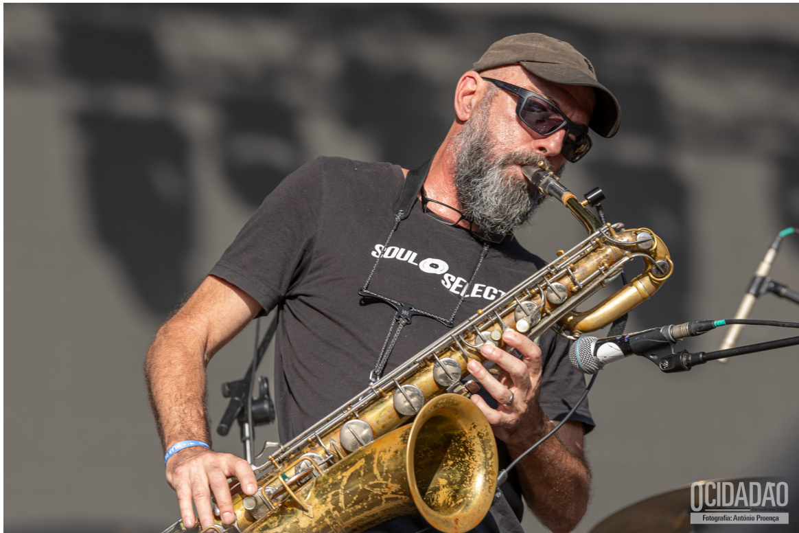
VAPORS OF MORPHINE

O músico português, David Fonseca , brilhou com uma performance envolvente e cheia de energia. Conhecido pela sua capacidade de misturar diferentes estilos musicais, subiu ao palco para apresentar um repertório que combinava os seus maiores sucessos com canções do seu mais recente trabalho tendo presenteado o público com momentos de grande emoção. [ALBUM FOTOS]