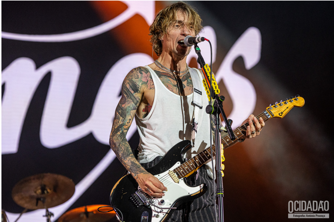
THE DARKNESS

O público do CA Vilar de Mouros, que incluiu várias gerações, participou ativamente, tornando o último dia uma celebração memorável da música ao vivo□