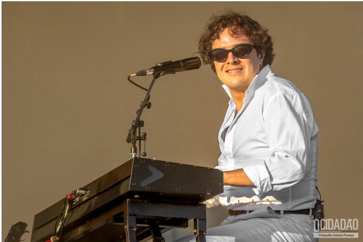
CAPITÃO FAUSTO

O grupo britânico Crystal Fighters , terceira banda a atuar, ofereceram uma fusão de indie, música eletrónica e influências da música folclórica basca, acrescentaram uma vibração festiva à noite com uma atuação vibrante, misturando sons eletrônicos com instrumentos acústicos. [ALBUM FOTOS]