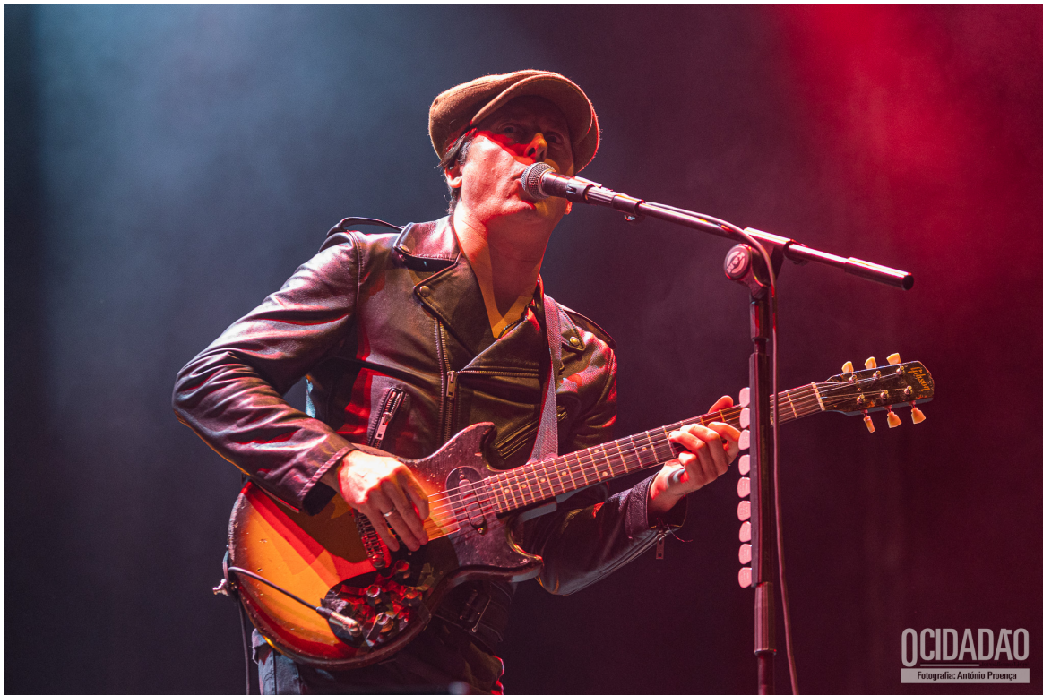
THE LIBERTINES

The Darkness , conhecidos pela sua mistura de hard rock e glam rock, o grupo liderado por Justin Hawkins trouxe uma performance cheia de energia e carisma.