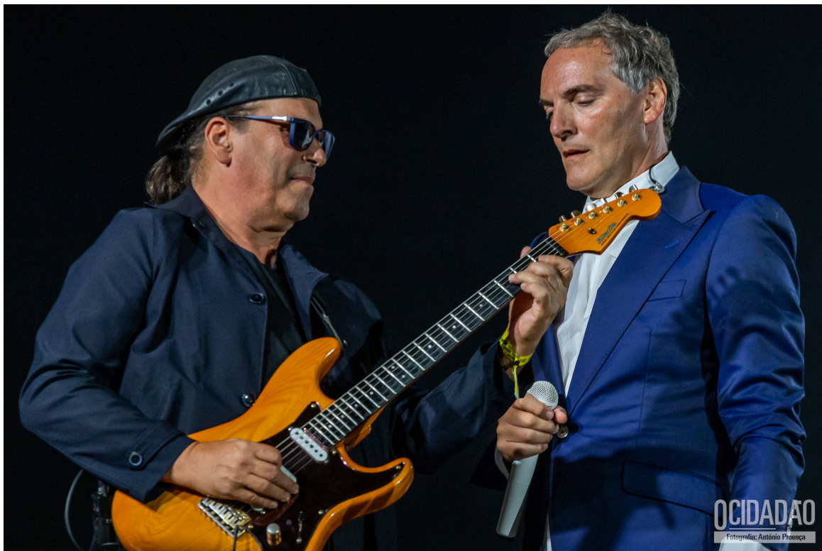
DELFINES | Foto: António Proença

O segundo dia do Festival CA Vilar de Mouros 2024 foi marcado por uma combinação intensa de metal e rock.