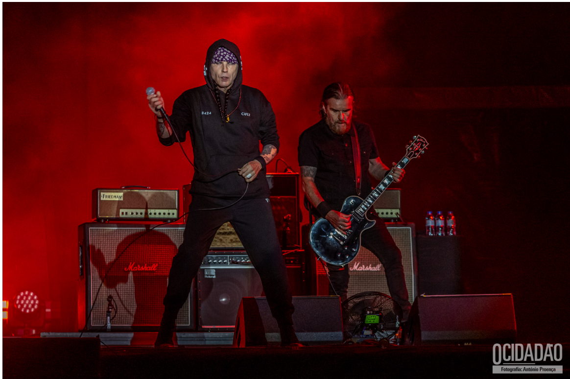
THE CULT

O terceiro dia do Festival CA Vilar de Mouros 2024, foi marcado por apresentações vibrantes e ecléticas, unindo fãs de várias gerações.