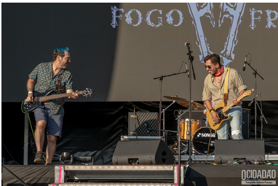
FOGO FRI0

Fogo Frito , banda de Caminha, que abriu o evento, apresentaram canções do seu ainda recente e curto repertório. [ ALBUM FOTOS ]