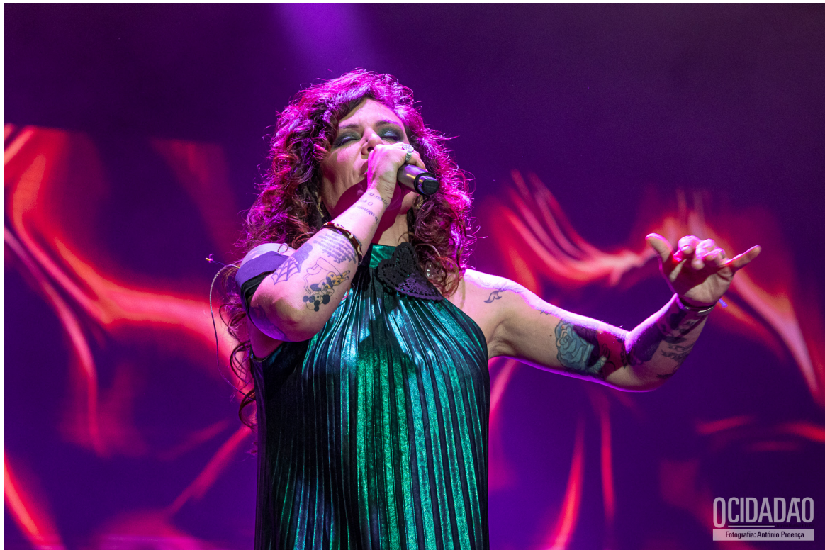
AMÁLIA HOJE

A banda Delfins encerrou o primeiro dia com seus grandes sucessos, proporcionando momentos nostálgicos ao público. A energia contagiante de Miguel Ângelo, e a química entre os membros da banda foram destaques da atuação, que foi muito bem recebida pelos fãs. [ ALBUM FOTOS ]