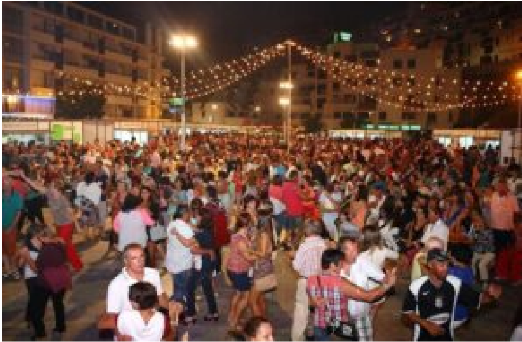
Festas regressam à Praça dos Pescadores.

A encerrar os festejos, no domingo, pelas 22h00, Bonga regressa a Albufeira e promete fazer jus ao estatuto de um dos maiores artistas angolanos de sempre. Depois de ter marcado presença no Festival Al'buhera em 2011, José Adelino Barceló de Carvalho, mais conhecido por Bonga, promete voltar a contagiar o público de Albufeira com temas dos seus mais de 40 álbuns editados.