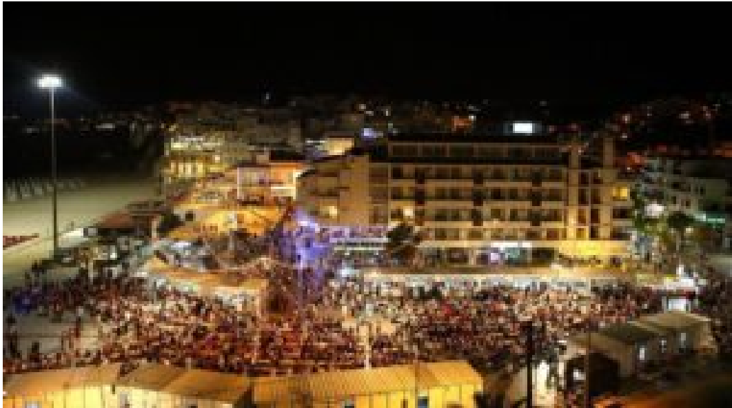
Festas regressam à Praça dos Pescadores.

A partir das 18h00, a Praça dos Pescadores serve de cenário à 18.ª edição do evento, que não dispensa a atuação de artistas regionais. Na primeira noite, pelas 20h30, sobe ao palco o Trio Impacto, seguido da banda José Praia e Água Viva, pelas 22h00.