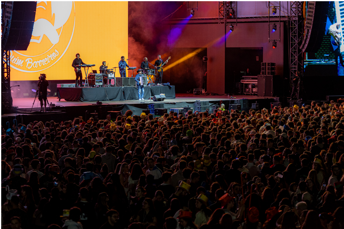
Quim Barreiros.

Mais do que um concerto, foi uma noite da consagração do espírito académico portuense – uma explosão de emoções que ficará gravada na memória de todos os que participaram.