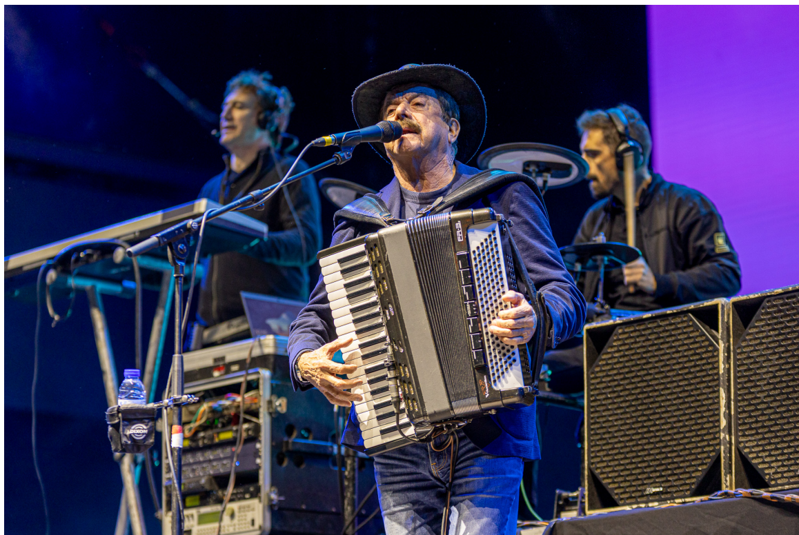
Quim Barreiros.

académicas de norte a sul do país, o artista voltou a provar porque é tão acarinhado pelos estudantes. Ao som de êxitos intemporais como “ A Cabritinha ”, “ Bacalhau à Portuguesa ” e “ A Garagem da Vizinha ”, Quim Barreiros fez o Queimódromo vibrar, numa atuação marcada por humor, energia e total sintonia com os milhares de estudantes presentes.