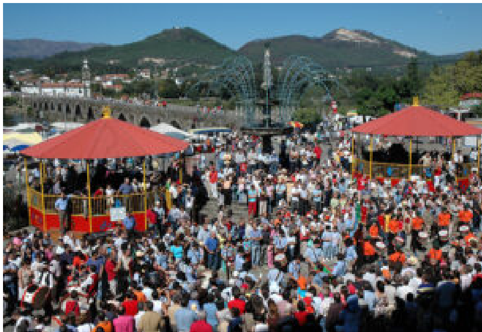
Feiras Novas.

Na quinta-feira, 11 de setembro, pelas 18h00, destaca-se a apresentação do livro “A Emblemática Raça Barrosã” , com conteúdos da Associação de Criadores de Bovinos de Raça Barrosã, edição do Município e da Associação Concelhia das Feiras Novas. A partir das 21h00, o Largo de Camões recebe concertos das Bandas de Música de Estorãos e Aboim da Nóbrega . Em simultâneo, o Festival de Gaitas anima a Rua Cardeal Saraiva com grupos de Portugal e da Galiza. A noite prolonga-se na Expolima com o Music Fest “Viva as Feiras Novas” , das 22h00 às 04h00.