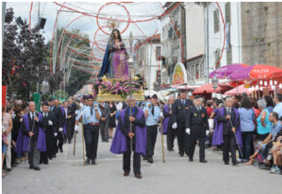
Feiras Novas.

O sábado, 13 de setembro, é a primeira Feira Franca e um dos dias mais intensos do cartaz. A partir das 08h00, há Zés Pereiras, Gaiteiros, Gigantones e Cabeçudos , seguidos de concertos pelas bandas de música de Ponte de Lima e Gueifães .