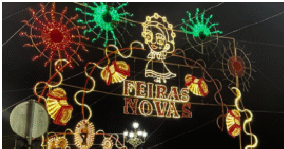
Feiras Novas.

O domingo, 14 de setembro, segunda Feira Franca , começa com os sons tradicionais da manhã e as bandas de música da Trofa e da Junqueira às 09h00 no Largo de Camões. O Cortejo Histórico , às 15h30, tem como tema “ E Fez Vila o Lugar de Ponte – 900 Anos de Foral ”, um tributo à longa história da vila. A tradicional Tourada decorre na Expolima às 18h00, e à noite, o Festival Limiano de Folclore enche de cor e música os palcos da vila, a partir das 21h00. A noite termina com o Fogo do Meio às 00h00 e mais uma madrugada de Music Fest .