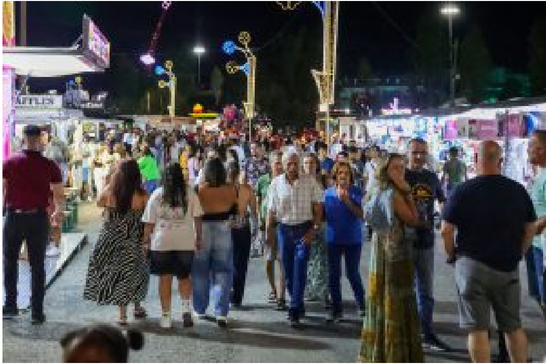
INAUGURAÇÃO DA FEIRA DE SANT'IAGO

O Palco Encontros , que dá espaço à criação emergente, às novas linguagens musicais e ao talento da cidade e da região, acolhe, por seu lado, mais de 30 atuações , enquanto na zona institucional estão representados o Poder Local e as diversas associações culturais, sociais e entidades locais, que ali partilham os seus projetos.