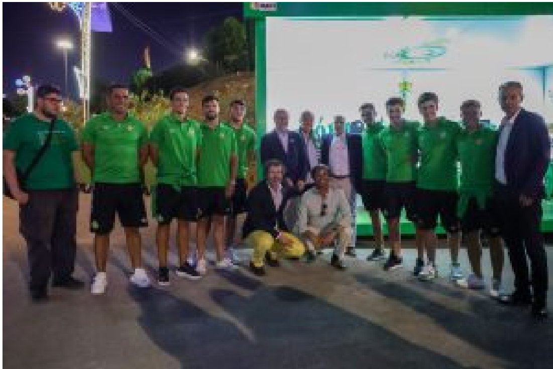
INAUGURAÇÃO DA FEIRA DE SANT' IAGO

Organizada pela Restart Vinil, a Feira do Livro e do Vinil vai promover o consumo cultural sustentável e a economia circular, sendo o compromisso do evento com a sustentabilidade reforçado pela utilização, pela primeira vez, do copo reutilizável oficial da Feira, com o valor simbólico de 50 cêntimos, uma iniciativa promovida com o parceiro ecológico SMS – Serviços Municipalizados de Setúbal.