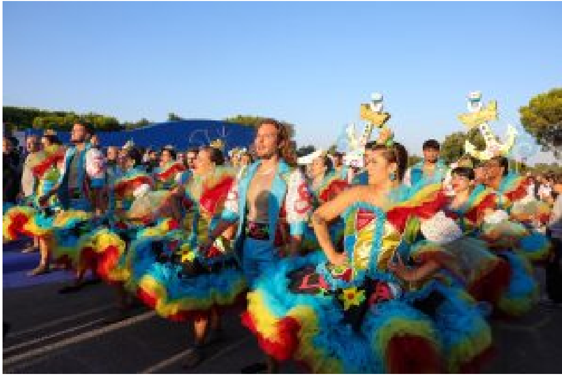
INAUGURAÇÃO DA FEIRA DE SANT'IAGO

O autarca assistiu à exibição da marcha do Grupo Desportivo Independente, vencedor das Marchas Populares de Setúbal 2025, visitou exposição “Setúbal Contemporânea” e a relativa ao centenário dos Serviços Municipalizados de Setúbal, e percorreu os stands de empresas e do movimento associativo, para terminar a noite junto de Dino d’Santiago , o artista que deu o primeiro concerto no Palco Sant’Iago.