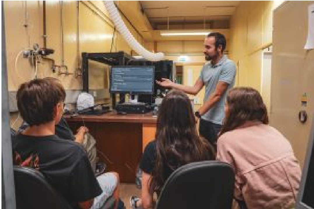
ESCOLA DE VERÃO DE FÍSICA (2024)

Há 20 anos que a Escola de Verão da Física inspira jovens estudantes, de várias partes do mundo, a explorar o mundo da física. Organizada pelo Departamento de Física e Astronomia da Faculdade de Ciências da Universidade do Porto (FCUP), a iniciativa tem proporcionado um contacto direto entre investigadores e alunos do ensino secundário apaixonados pela ciência.