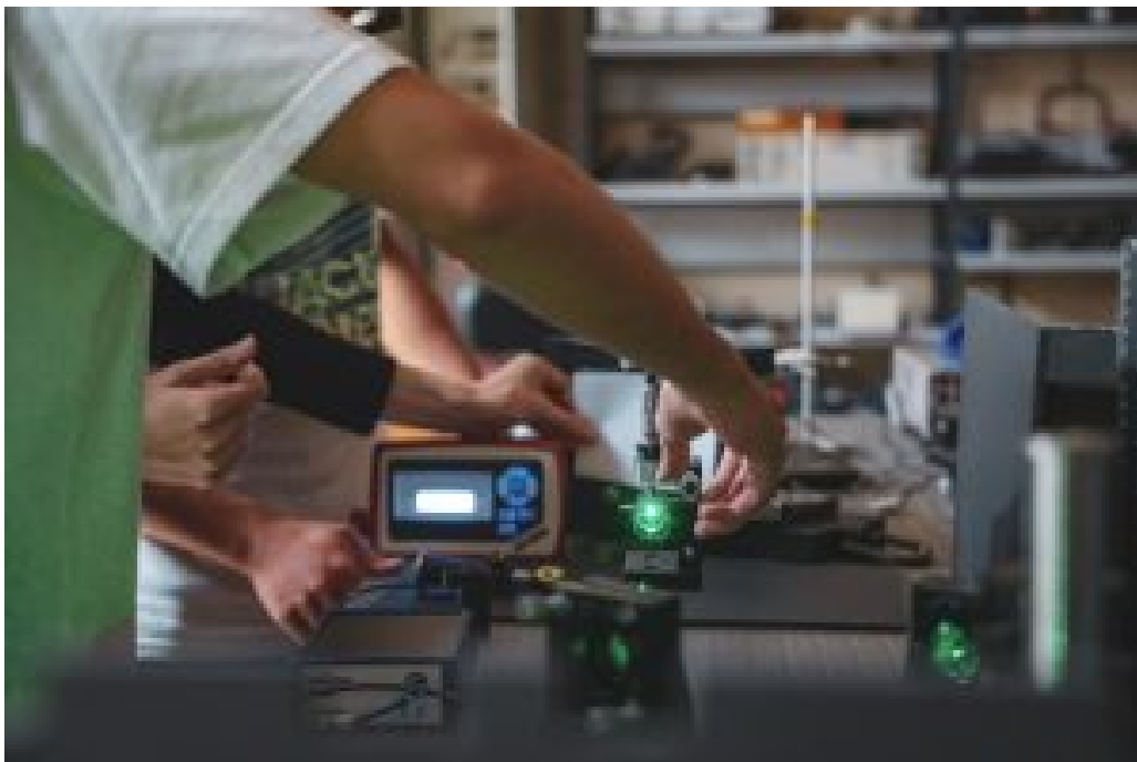
ESCOLA DE VERÃO DE FÍSICA (2024)