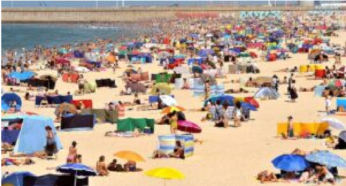
Praia de Matosinhos.

Segue-se Viana do Castelo , com 13 locais galardoados , mais duas do que em 2025, enquanto Póvoa de Varzim mantém oito e Vila do Conde cinco.