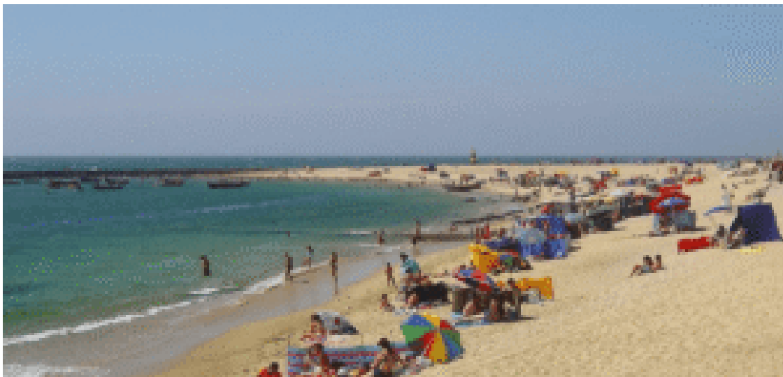
Praia de Gaia.

Quanto às águas balneares identificadas a Norte, são 121 em 2026, de acordo com a portaria do Governo publicada no Diário da República de 30 de abril.