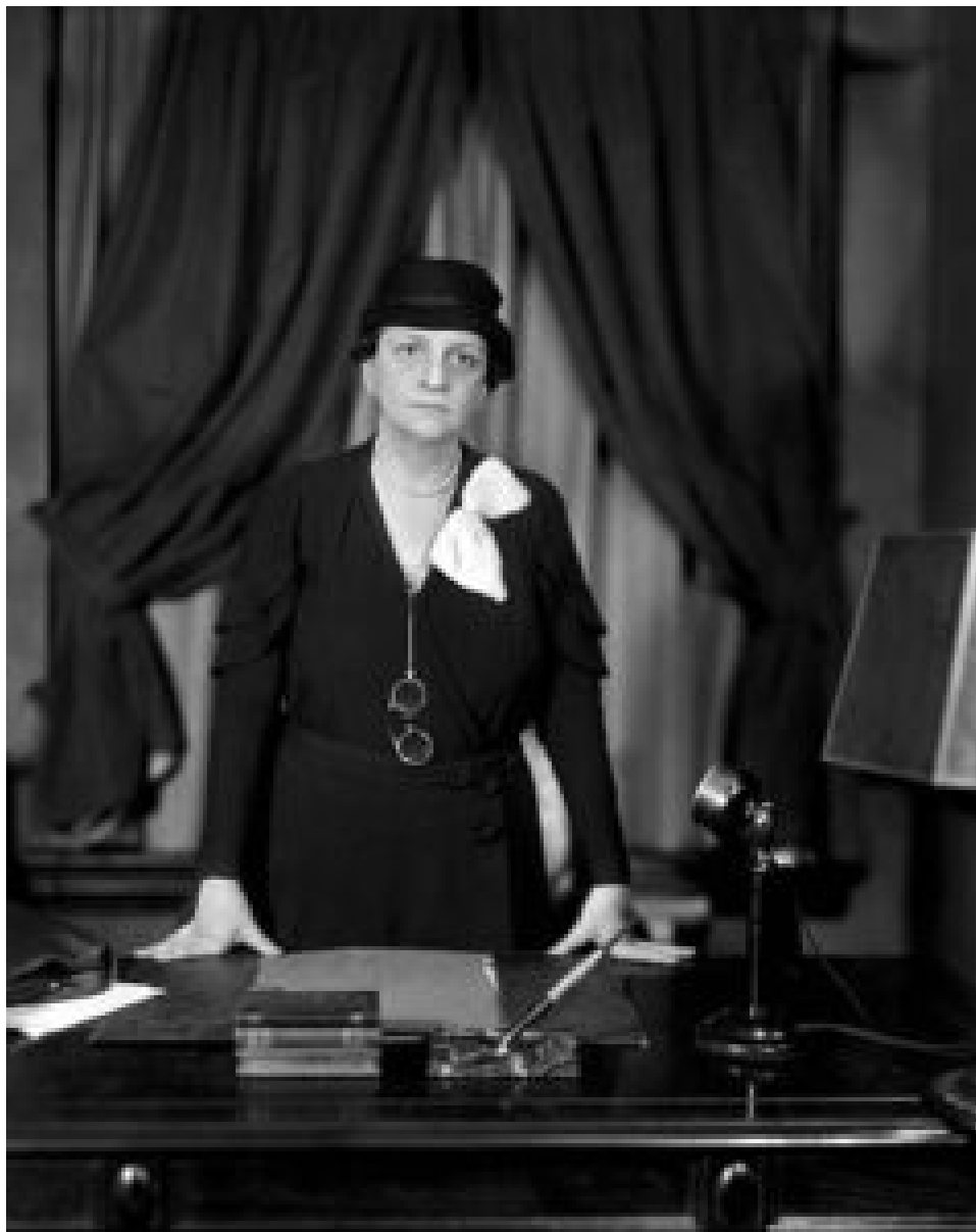
Frances Perkins. Direitos Reservados

Então deflagrou o incêndio na Triangle Shirtwaist Factory. Dez andares de fogo, fumo e gritos. Frances viu as jovens a morrerem por causa da ganância e, no dia seguinte, começou a lutar para mudar o país.