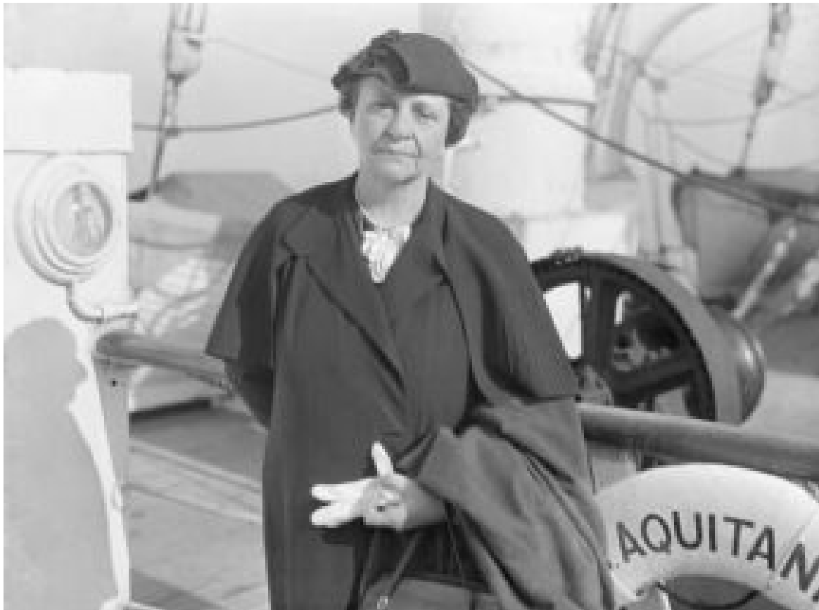
Frances Perkins.

Quando criança, perguntava-se por que razão pessoas boas viviam na miséria. O pai respondia: “Porque são preguiçosas, porque são fracas.” Mesmo menina, Frances sabia que aquilo não correspondia à verdade.