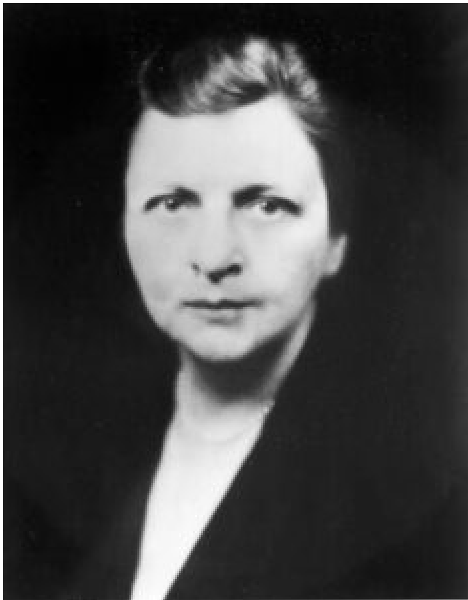
Frances Perkins.

Abandonou o destino “seguro” de esposa e professora de piano dos filhos dos ricos. Concluiu um mestrado em Economia e Sociologia em Columbia, escrevendo sobre a fome e a miséria em Hell’s Kitchen. A família ficou horrorizada “as moças de bem” não estudavam a pobreza, muito menos viviam entre os pobres. Frances não se importou. Prosseguiu.