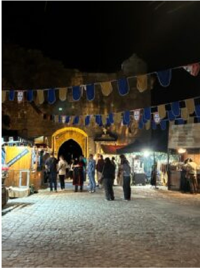
Muralhas com História.

Através de sons, personagens e cenários, Sortelha promete ser palco de uma autêntica imersão no espírito medieval, valorizando e promovendo o património e a identidade desta aldeia histórica.