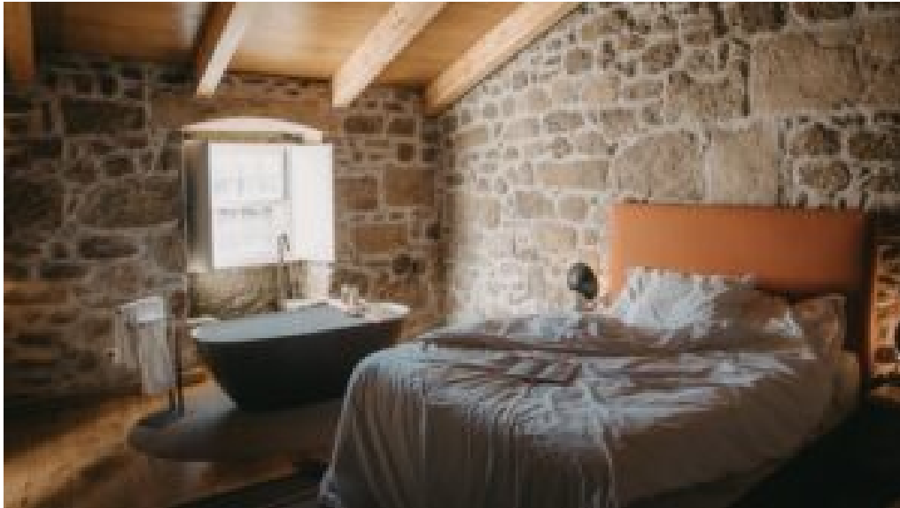
Story Studio Sortelha.

As várias tipologias (T0, T1 e T2) no Story Studio combinam arquitetura secular com design contemporâneo e soluções sustentáveis, proporcionando uma estadia que alia conforto, ecoeficiência e a envolvimento mágica do património histórico.