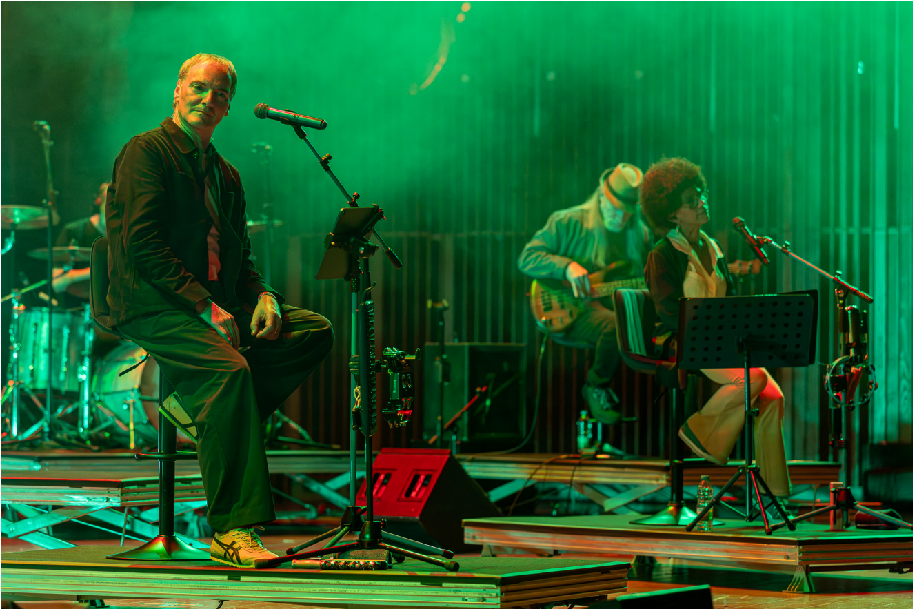
Delfins na Casa da Música, Porto.