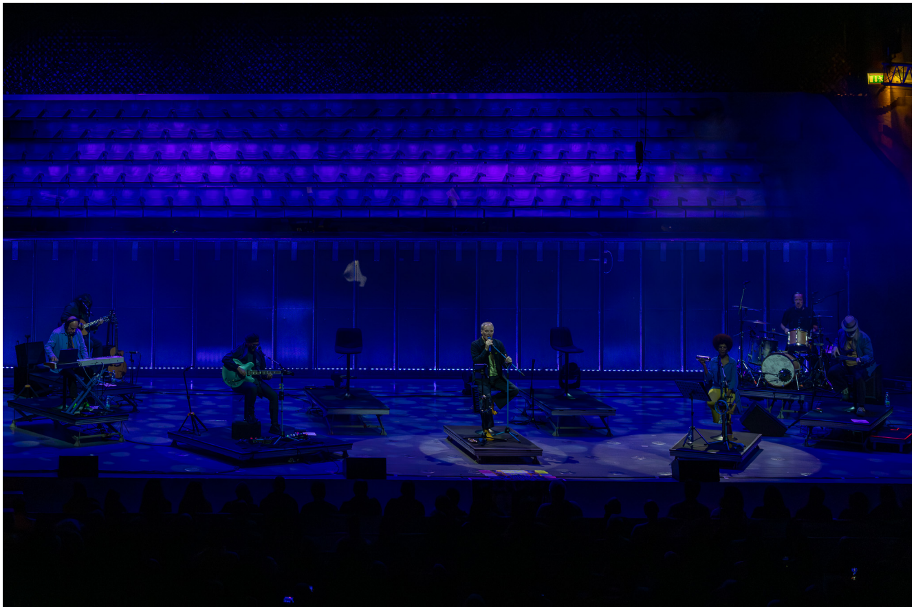
Delfins na Casa da Música, Porto.