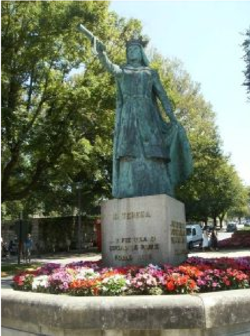
D. TERESA... E FEZ VILA O LUGAR DE PONTE

Esta vila portuguesa situada na sub-região do Alto Minho integra o universo das vilas mais antigas do país, se não mesmo a mais antiga de todas, como defendem algumas teses. Hoje, os limianos tentam honrar a dádiva de D. Teresa, da semente que ela lançou à Terra há 900 Anos ao Fazer Vila o Lugar de Ponte.