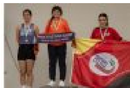
Torneio Regional de Marcha em Pista.