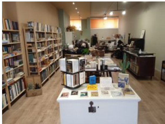
Foto de António Ferro

Os livros estão muito bem alinhados, de afável e acessível consulta, a quem “vagueia” e perambula pelo espaço, colorante e redolente, pela gratuidade de quem nos recebe.